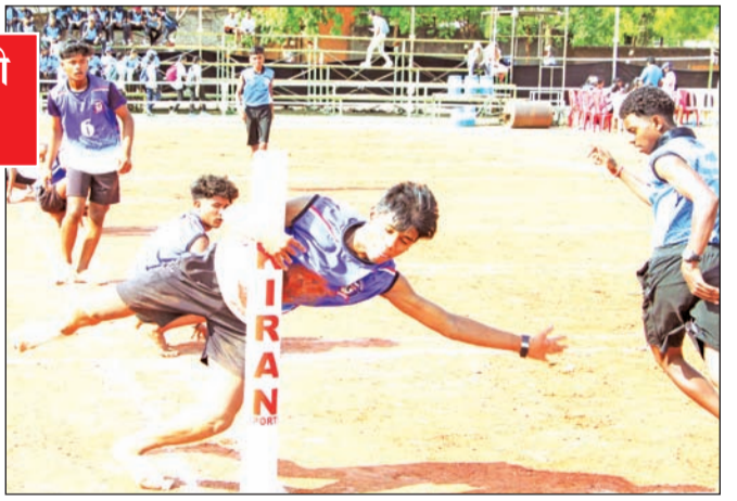
सोलापूर : पुणे विरुद्धच्या सामन्यात नांदेडचा आक्रमक पुण्याच्या संरक्षकाला पोलवर टिपताना.