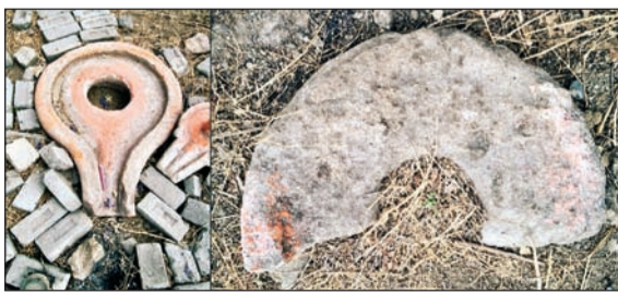
बोर गावातील प्राचीन शिवलिंग