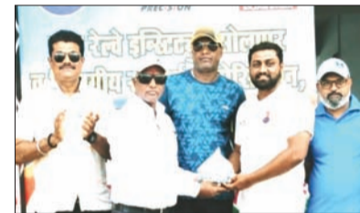
सकाळी : मांडेल क्रिकेट अकॅडमी विरुद्ध एस एस आय क्लब.