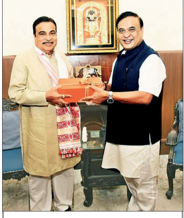
आसामचे मुख्यमंत्री हेमन्ता बिस्व सर्मा यांनी सोमवारी नवी दिल्लीत केंद्रीय मंत्री नितीन गडकरी यांची भेट घेतली