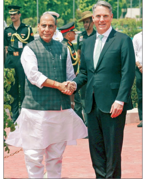
ऑस्ट्रेलियाचे उपपंतप्रधान रिचर्ड मार्ल्स यांच्याशी हस्तांदोलन करताना संरक्षण मंत्री राजनाथ सिंह

◆ नवी दिल्ली, १ जून पश्चिम आशिया संकटानंतर ऊर्जा पुरवठा साखळीत निर्माण झालेला व्यत्यय आणि भारत-प्रशांत क्षेत्रात चीनच्या वाढत्या आक्रमकतेबद्दलची चिंता या पृष्ठभूमीवर, भारत आणि ऑस्ट्रेलियाने सोमवारी नौकावहन, हवाई वाहतूक आणि सागरी व्यापाराच्या स्वातंत्र्याचे महत्त्व अधोरेखित केले. नवी दिल्लीत संरक्षण मंत्री राजनाथ सिंह आणि ऑस्ट्रेलियाचे उपपंतप्रधान रिचर्ड मार्ल्स यांच्यात झालेल्या व्यापक चर्चेदरम्यान या मुद्द्यांवर प्रामुख्याने चर्चा झाली. भारत आणि ऑस्ट्रेलिया यांच्यातील संरक्षण औद्योगिक सहकार्य आणि संबंधांच्या सामरिक महत्त्वावर भर देताना, दोन्ही मंत्र्यांनी प्रादेशिक भागीदारांसोबत सहकार्य वाढवण्याच्या महत्त्वावर जोर दिला. संरक्षण औद्योगिक सहकार्य अधिक दृढ करण्याच्या पुढील टप्प्यात दोन्ही देश संरक्षण सामग्री आणि संरक्षण सेवांच्या तरतुदीसंदर्भात सामंजस्य करार विकसित करण्यास सुरुवात करतील, अशी घोषणा चर्चेनंतर, सिंह आणि मार्ल्स यांनी केली. मंत्र्यांनी द्विपक्षीय सागरी सुरक्षा सहकार्यातील प्रगती आणि संयुक्त सागरी सुरक्षा सहकार्य आराखडा अंतिम करण्याच्या प्रयत्नांवर चर्चा केली, असे एका संयुक्त निवेदनात म्हटले आहे. ◆(वृत्तसंस्था)