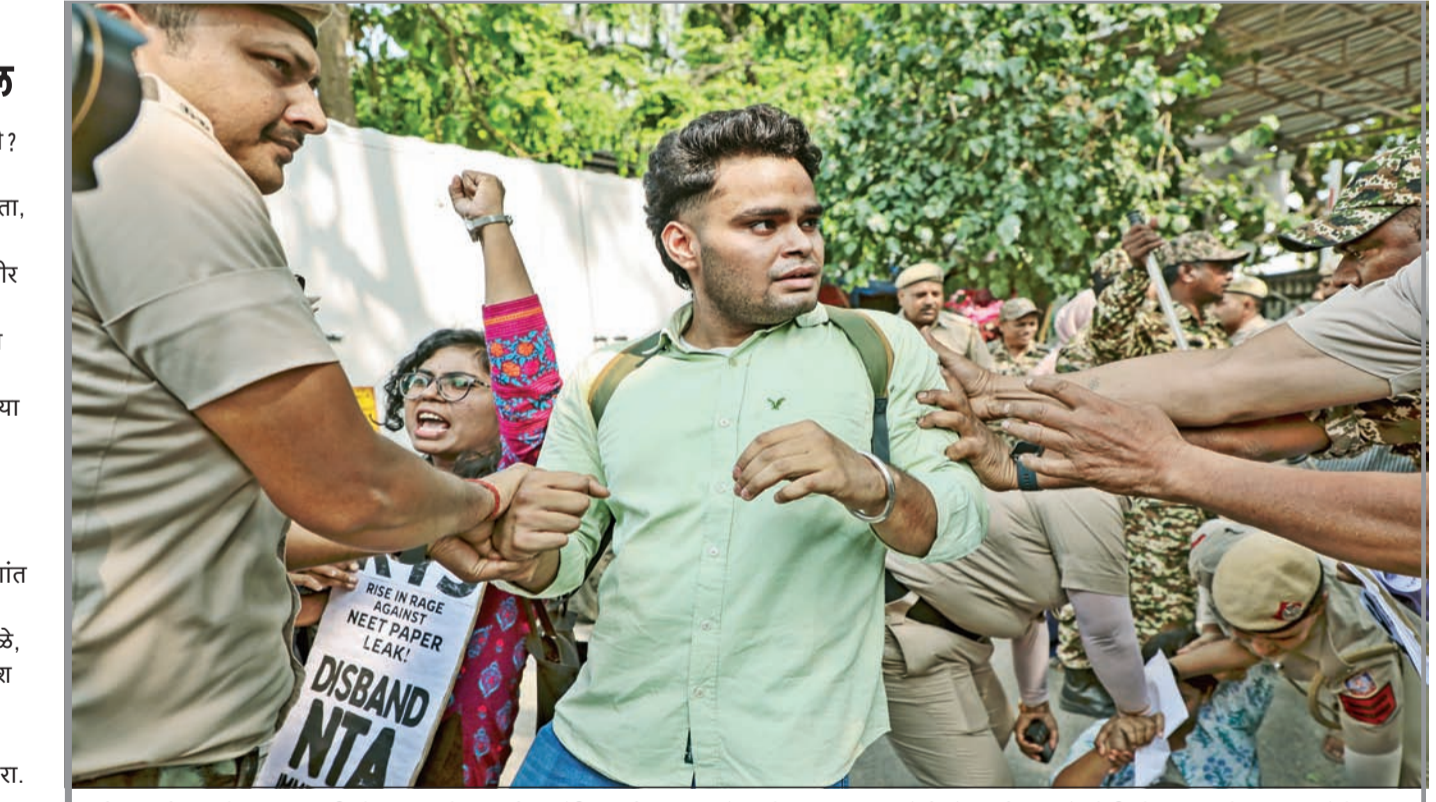
नीट परीक्षा पेपर फुट विरोधात सोमवारी क्रांतिकारी युवा संघटनेच्या सदस्यांनी 'एनटीए' संस्थेविरोधात जोरदार आंदोलन केले. आंदोलकांना ताब्यात घेताना दिल्ली पोलीस