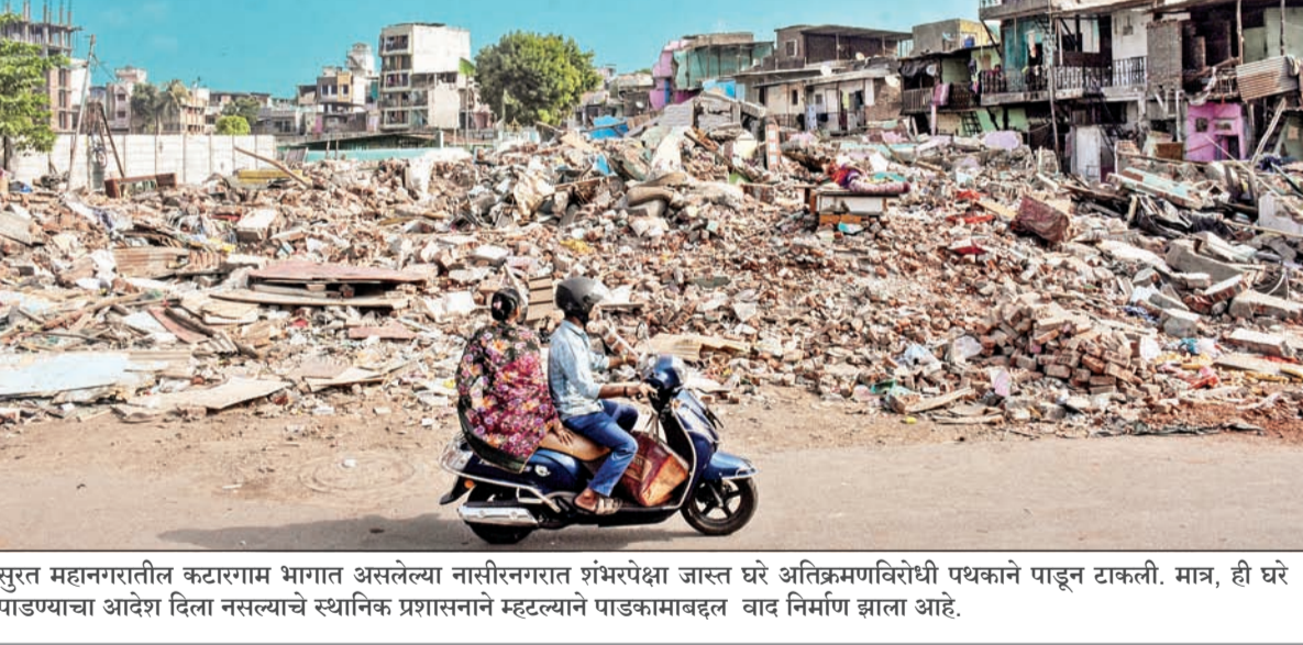
सुरत महानगरातील कटारगाम भागात असलेल्या नासिरनगरात शंभरपेक्षा जास्त घरे अतिक्रमणविरोधी पथकाने पाडून टाकली. मात्र, ही घरे पाडण्याचा आदेश दिला नसल्याचे स्थानिक प्रशासनाने म्हटल्याने पाडकामाबद्दल वाद निर्माण झाला आहे.