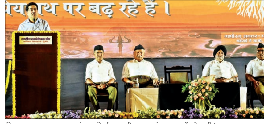
विचार व्यक्त करताना कुमार मंगलम बिरला. व्यासपीठावर सरसंघचालक डॉ. मोहनजी भागवत व मान्यवर

◆ नागपूर, ४ जून भारत सध्याच्या 'अमृतकाळ'त विकसित राष्ट्रकाडे वाटचाल करीत आहे. हा काळ भारतीय युवांसाठी अभूतपूर्व संधी घेऊन आला आहे. या सुवर्णसंधीचा लाभ घेत देशाच्या सर्वांगीण विकासात मोलाचे योगदान देण्याचे आव्हान प्रसिद्ध उद्योगपती व पद्मभूषण पुरस्काराने सन्मानित कुमार मंगलम बिरला यांनी युवकांना केले.