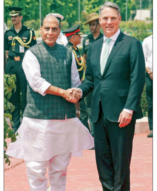
ऑस्ट्रेलियाचे उपपंतप्रधान रिचर्ड मार्ल्स यांच्याशी हस्तांदोलन करताना संरक्षण मंत्री राजनाथ सिंह

नवी दिल्लीत संरक्षण मंत्री राजनाथ सिंह आणि ऑस्ट्रेलियाचे उपपंतप्रधान रिचर्ड मार्ल्स यांच्यात झालेल्या व्यापक चर्चेदरम्यान या मुद्द्यांवर प्रामुख्याने चर्चा झाली. भारत आणि ऑस्ट्रेलिया यांच्यातील संरक्षण औद्योगिक सहकार्य आणि संबंधांच्या सामरिक महत्त्वावर भर देताना, दोन्ही मंत्र्यांनी प्रादेशिक भागीदारांसोबत सहकार्य वाढवण्याच्या महत्त्वावर जोर दिला. संरक्षण औद्योगिक सहकार्य अधिक दृढ करण्याच्या पुढील टप्प्यात दोन्ही देश संरक्षण सामग्री आणि संरक्षण सेवांच्या तरतुदीसंदर्भात सामंजस्य करार विकसित करण्यास सुरुवात करतील, अशी घोषणा चर्चेनंतर, सिंह आणि मार्ल्स यांनी केली. मंत्र्यांनी द्विपक्षीय सागरी सुरक्षा सहकार्यातील प्रगती आणि संयुक्त सागरी सुरक्षा सहकार्य आराखडा अंतिम करण्याच्या प्रयत्नांवर चर्चा केली, असे एका संयुक्त निवेदनात म्हटले आहे.