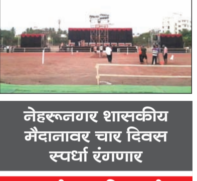
नेहस्वर्णगार शासकीय मैदानावर चार दिवस स्पर्धा रंगणार

राज्यातील २४ जिल्हातील कुमार व मुलींचा सहभाग