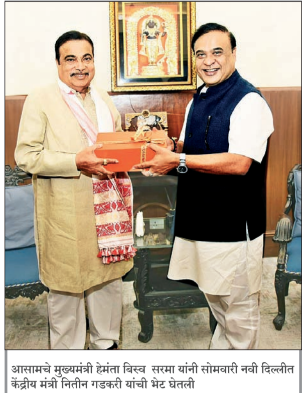
आसामचे मुख्यमंत्री हेमंता बिस्व सरमा यांनी सोमवारी नवी दिल्लीत केंद्रीय मंत्री नितिन गडकरी यांची भेट घेतली

टिप्पणी केली की, न्यायालयाने यापूर्वीही अशाच प्रकारच्या याचिका फेटाळल्या आहेत. याचिकाकर्त्यांच्या वकिलांने पुनरुच्चार केला की, ते केवळ सीबीटी संबंधित मागणीवरच आग्रह धरत आहेत. यावर न्यायासनाने या प्रकरणावर तात्काळ सुनावणी होणार नाही, असे स्पष्ट केले. न्यायमूर्ती नरसिंह म्हणाले, आम्ही सध्यानंतर याकडे पाहू, असे सांगत त्यांनी सुनावणी तहकूब केली. (वृत्तसंस्था)