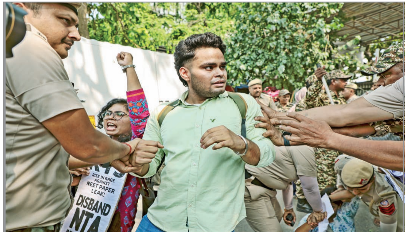
नीट परीक्षा पेपर फुट विरोधात सोमवारी क्रांतिकारी युवा संघटनेच्या सदस्यांनी 'एनटीए' संस्थेविरोधात जोरदार आंदोलन केले. आंदोलकांना ताब्यात घेताना दिल्ली पोलिस