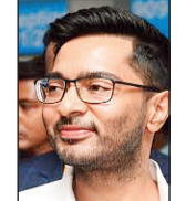
नोटीसमागे सरकारी कोणतीही भूमिका नाही मुख्यमंत्री शुभेन्द्र अधिकारी यांनी यासंदर्भात सांगितले की, अभिषेक बॅनर्जी यांना सीआयडीने बजावलेल्या नोटीसमध्ये भाजपा किंवा सरकारी कोणतीही भूमिका नाही. सही बनावट केल्याच्या आरोपाच्या तपासाचा भाग म्हणून सीआयडीने त्यांना सोमवारी हजर राहण्यास सांगितले होते. पण ते हजर झाले नाही. त्यांनी हजर होण्यास सीआयडीला १५ दिवसांची मुदत मागितली आहे. आजवरपण किंवा इतर कारणांमुळे मुदतवाढ देण्याचा निर्णय सीआयडीचा आहे. (वृत्तसंस्था)

राज्यात राजकीय वातावरण तापले आहे. तुणमूल काँग्रेस सत्ताधारी भाजपावर सुडाच्या राजकारणाचे आरोप करत आहे तर भाजपाकडूनही जोरदार प्रत्युत्तर दिले जात असल्यामुळे दोन्ही पक्षात आरोप-प्रत्यारोपाचा राजकीय कलगीतुरा रंगला आहे. दरम्यान, भाजपा प्रदेशाध्यक्ष तथा केंद्रीय शिक्षण राज्यमंत्री सुकान्त मजुमदार म्हणाले, कायद्यासमोर कोणीही मोठा नाही. त्यांना सीआयडीसमोर हजर व्हावेच लागेल. त्यांना हे टाळता येणार नाही.