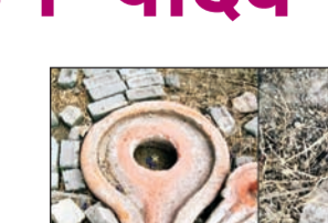
बोर गावातील प्राचीन शिवलिंग