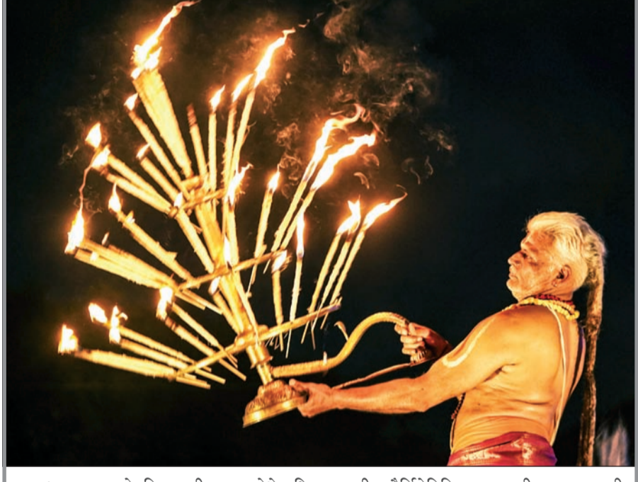
राजस्थानच्या अजमेर जिल्ह्यातील पुष्कर येथे अधिक मासातील पौर्णिमेनिमित्त महाआरती करताना पुजारी

काही कोलेस्ट्रॉल नियंत्रण औषधांची किंमत १८.४६ प्रति गोळी इतकी ठेवण्यात आली आहे. एनपीपीएच्या मते, या निर्णयाचा मुख्य उद्देश अत्यावश्यक औषधे सर्वसामान्यांना वाजवी दरात उपलब्ध करून देणे आणि बाजारातील अनियंत्रित किमतींवर नियंत्रण ठेवणे हा आहे. नवीन दर लागू झाल्याने आरोग्यसेवा खर्चात काही प्रमाणात दिलासा मिळण्याची शक्यता आहे. ■ संबंधित घटक असलेल्या गोळ्यांची किंमत प्रति टॅब्लेट सुमारे १९.७८ निश्चित करण्यात आली आहे. (वृत्तसंस्था)