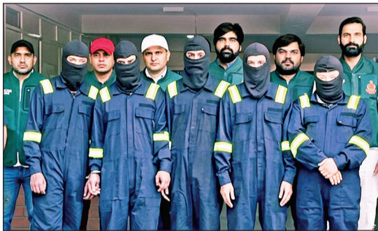
दिल्ली पोलिसांनी अटक केलेले दहशतवादी

वांद्रे स्थानकाजवळील गरीबनगर येथील अनधिकृत बांधकामे पाडण्यासाठी १९ ते २३ मे या कालावधीत राबवण्यात आलेल्या मोहिमेदरम्यान दहशतवाद्यांनी अतिक्रमण करून घेतले. यात पोलिसांसह १० जण जखमी झाले. गरीबनगर येथील अतिक्रमण हटाव मोहिमेची संधिपतानी पाहणी केली होती आणि पोलिसांच्या तैनातीचे व्हिडीओ व छायाचित्रे पाकिस्तानातील सूत्रधारांकडे पाठवली होती, अशी माहिती मुंबई पोलिसांच्या एका वरिष्ठ अधिकाऱ्याने रविवारी वृत्तस्थेला दिली.