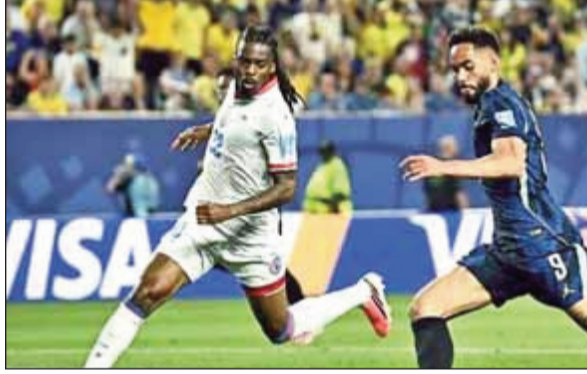
आहेत. स्कॉटलंडचे तीन गुण आहेत, तर हैती एकही गुण न मिळवता

स्कॉटलंडवर १-० ने विजय मिळवल्यानंतर मोरोक्कोने ब्राझीलच्या बरोबरीने गुण मिळविले