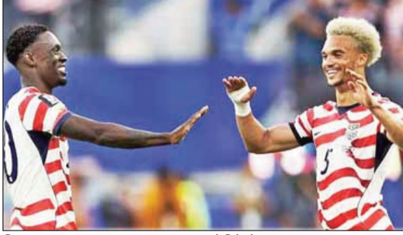
विजयाचा आनंद साजरा करताना अमेरिकेचे फुटबॉलपटू

दोन्ही संघांचा हा विश्वचषकातील दुसरा साखळी सामना होता व त्यात अमेरिकेने आपली विजयी घोडदौड कायम राखत आगेकूच केला. सिएटल स्टेडियमवर झालेला हा सामना या दोन्ही देशांच्या फुटबॉल इतिहासातील