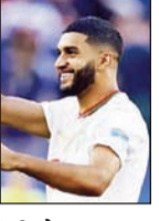
इस्माईल सायबारीने फिफा