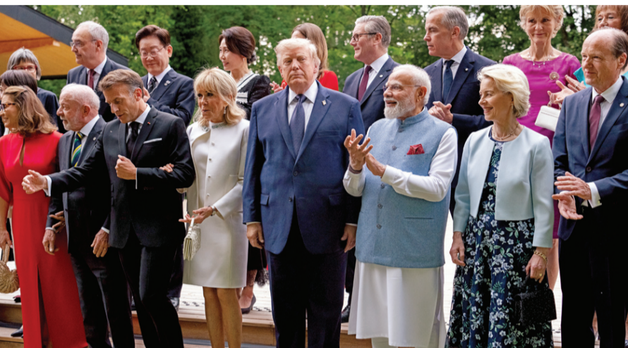
फ्रान्समधील जी-७ परिषदेच्या बैठकीत उपस्थित पंतप्रधान नरेंद्र मोदी, डॉनाल्ड ट्रम्प, इतर सदस्य देशांचे नेते

सागरी मार्गातील असुरक्षा अर्थव्यवस्थेसाठी धोकादायक