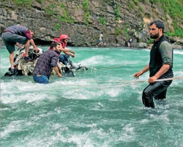
अनंतनाग जिल्ह्यातील आरू खोऱ्यात बुधवारी पहलगाम मार्गावरून जाणारे एक चारचाकी वाहन लिड्डेर नदीत कोसळले. यात दोघांचा मृत्यू झाला तर काही जखमी झाले. जखमींना बाहेर काढताना मदत आणि शोध पथकाचे जवान