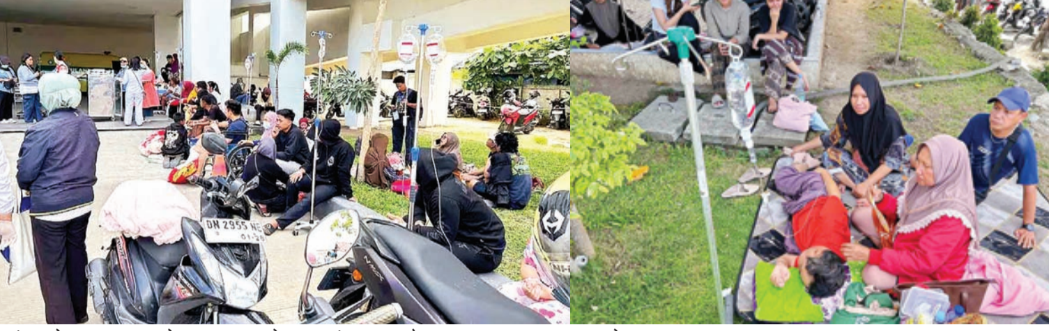
भूकंपामुळे रुग्णालयातून बाहेर काढण्यात आलेल्या रुग्णांवर खुल्या मैदानात उपचार सुरू करण्यात आले

शेकडो नागरिक जखमी, अनेक इमारतीचे नुकसान | रुग्णांवर खुल्या मैदानात उपचार, त्सुनामीचा इशारा