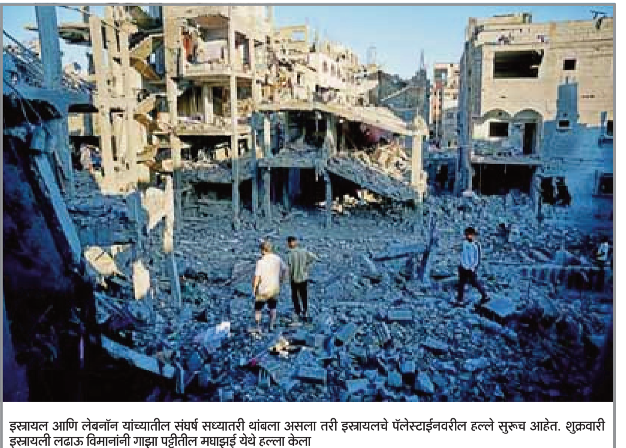
इस्त्रायल आणि लेबनॉन यांच्यातील संघर्ष सध्यातरी थांबला असला तरी इस्त्रायलचे पॅलेस्टाईनवरील हल्ले सुरूच आहेत. शुक्रवारी इस्त्रायली लढाऊ विमानांनी गाझा पट्टीतील म्हाझुझ येथे हल्ला केला

यबीने स्वतंत्र, निष्पक्ष आणि पुराव्यावर आधारित तपाससाठी आपली पूर्ण वचनबद्धता पुन्हा व्यक्त केली. (वृत्तसेवा)