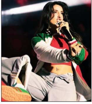
फुटबॉल विश्वचषक स्पर्धेपूर्वी आयोजित काऊंटडाऊन कॉन्सर्टमध्ये सादरीकरण करताना नोरा फतेही व शकिरा

◆ मेक्सिको, ११ जून अमेरिका-इराण युद्धाच्या सावटाखाती फिफा विश्वचषक फुटबॉल स्पर्धा अमेरिका, कॅनडा आणि मेक्सिकोमध्ये गुरुवार मध्यरात्रीपासून प्रारंभ होणार आहे. पुरुषांच्या फिफा विश्वचषकाची ही २३ वी आवृत्ती स्पर्धेच्या इतिहासातील सर्वात मोठी आवृत्ती असेल. फुटबॉलमधील सर्वात प्रतिष्ठित विश्वविजेतेपदासाठी गतविजेता अर्जेन्टिनासह प्रथम ४८ संघ झुंजणार आहेत. अमेरिका, कॅनडा व मेक्सिकोमधील १६ यजमान शहरांमध्ये विक्रमी १०४ सामने खेळवले जातील.