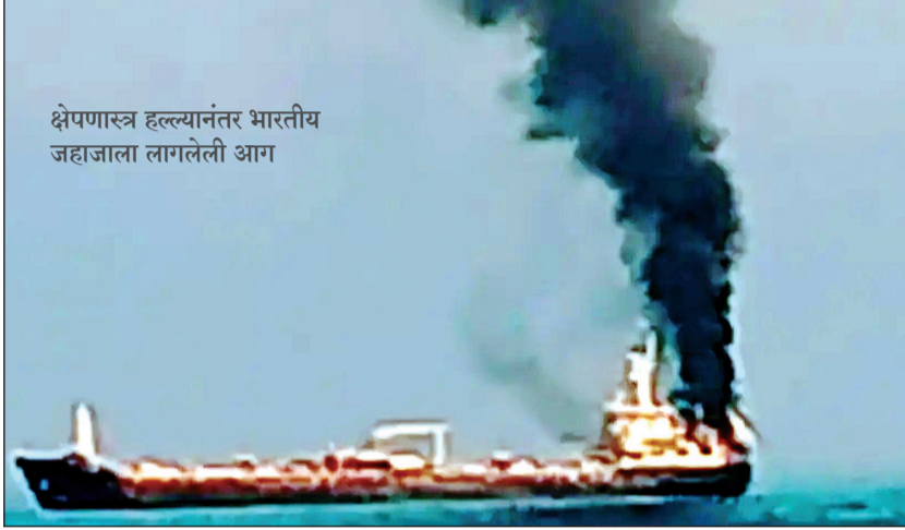
क्षेपणास्त्र हल्ल्यानंतर भारतीय जहाजाला लागलेली आग