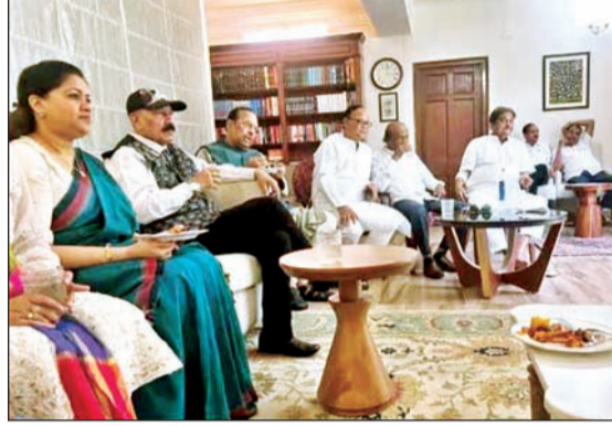
केंद्रीय मंत्री भूपेंद्र यादव यांचे निवासस्थानी बैठकीसाठी आलेले तृणमूल काँग्रेसचे खासदार

पश्चिम बंगालमध्ये मोठा पराभव स्वीकारल्यानंतर तृणमूल काँग्रेसला दिल्लीतही मोठा धक्का बसला आहे. तृणमूलच्या विधिमंडळ पक्षात फूट पडल्यानंतर आता तृणमूल काँग्रेस सांसदीय पक्षातही फूट पडण्याची शक्यता निर्माण झाली आहे. १४ खासदारांनी वेगळा गट बनवत लोकसभेत आपली बसण्याची वेगळी व्यवस्था करण्यात यावी, अशी मागणी एका पत्रातून लोकसभेचे अध्यक्ष ओम बिरला यांच्याकडे केली आहे. रालोआला पाठिंब्या देण्याची घोषणाही तृणमूल काँग्रेसच्या बंडखोर गटाने केली आहे.