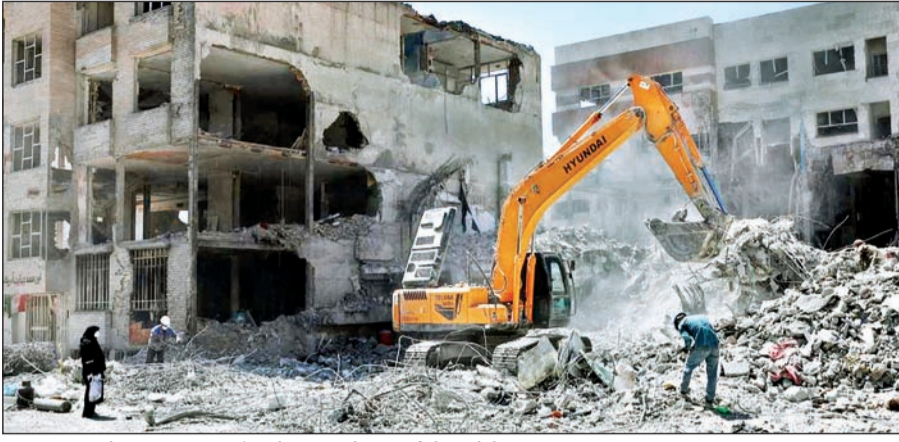
इस्रायलच्या क्षेपणास्त्र हल्ल्यांनंतर तेहरानमध्ये इमारतीचे झालेले नुकसान

● तेल अवीववर डागली क्षेपणास्त्रे ● इस्रायलने केले प्रतिहल्ले ● भारतीय नागरिकांना इराण सोडण्याचा सल्ला