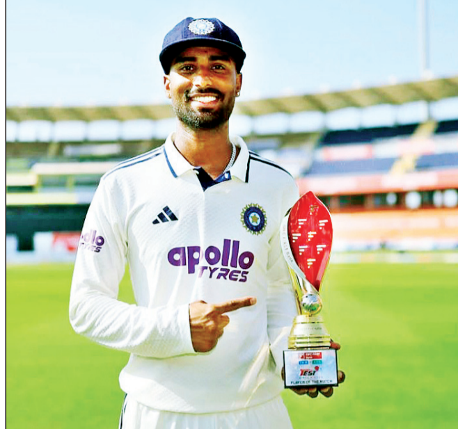
सामनावीर मानव सुथार

भारताविरुद्धचा हा अफगाणिस्तानचा दुसराच कसोटी क्रिकेट सामना होता. या एकमेव कसोटी सामन्याच्या तिसऱ्या दिवशी सकाळीच अफगाणिस्तानची अवरुधा बिकट झाली होती. अफगाणिस्तानच्या फलंदाजांनी आक्रमक पवित्रा घेतच खेळ केला.