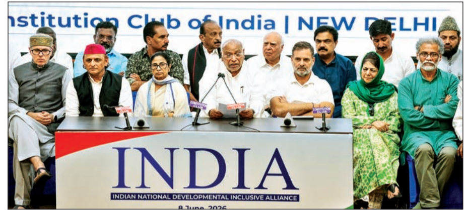
नवी दिल्ली येथील बैठकीनंतर पत्रकार परिषदेत सहभागी झालेले इंडिया आघाडीचे नेते