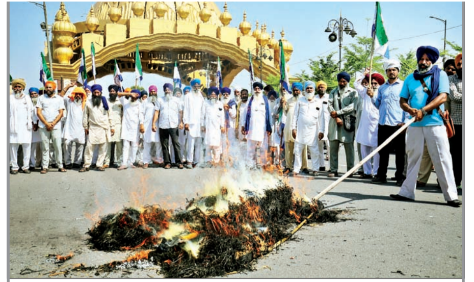
युरियासह अन्य खातांचा तुटवडा आणि काळाबाजार यामुळे संतप्त झालेल्या किसान मजदूर संघर्ष समितीच्या सदस्यांनी सोमवारी अमृतसर येथे आंदोलन केले

राष्ट्राध्यक्ष डोनाल्ड ट्रम्प यांनी इस्रायलचे पंतप्रधान बेंजामिन नेतन्याह यांना तात्काळ मोठ्या प्रतिहल्ल्यापासून वाचण्यास सांगितले होते. तरीही यानंतरही इस्रायलने इराणमध्ये लष्करी कारवाई केली. इराण आणि इस्रायल यांच्यातील हा ताजा संघर्ष दोन्ही देशांमध्ये युद्धविरामाबाबत आधीपासूनच तणाव निर्माण झाला असताना झाला आहे.