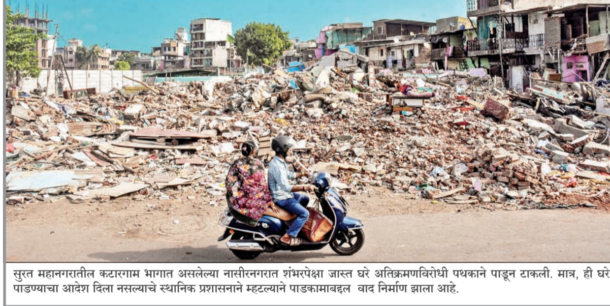
सुरत महानगरातील कटारगाम भागात असलेल्या नासीरनगर शंभरपेक्षा जास्त घरे अतिक्रमणविरोधी पथकाने पाडून टाकली. मात्र, ही घरे पाडण्याचा आदेश दिला नसल्याचे स्थानिक प्रशासनाने म्हटल्याने पाडकामाबद्दल वाद निर्माण झाला आहे.