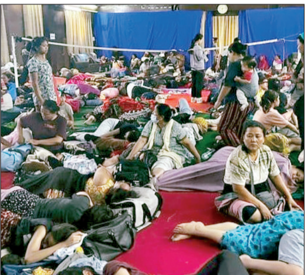
इम्फाळमध्ये ९४, काकचिंगमध्ये ६० आणि पूर्व इम्फाळमध्ये २५ मृत्यूंची नोंद झाली. दरम्यान, जिरिबाममध्ये १३, थोबलमध्ये ११ आणि तेंगोपाळमध्ये एकाचा मृत्यू झाला. संघर्ष सुरू होऊन तीन वर्षे उलटली तरी परिस्थिती सामान्य झालेली नाही. राज्यभरातील ४३,००० हून अधिक लोक अजूनही मदत शिबिरे आणि पूर्वनिर्मित घरांमध्ये राहत आहेत. (वृत्तसंस्था)