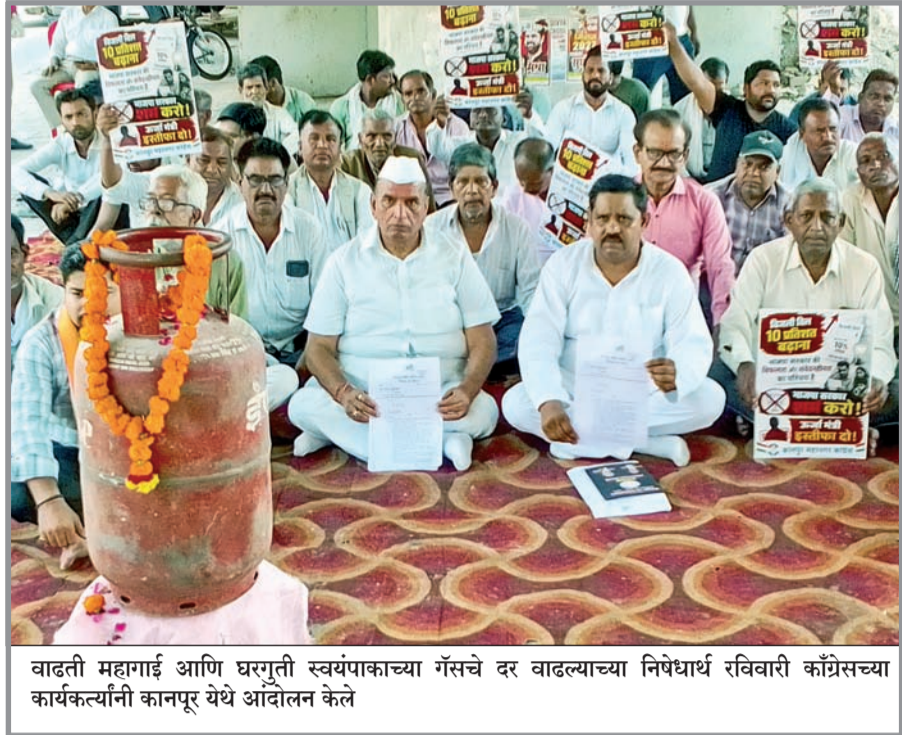
वाढती महागाई आणि घरगुती स्वयंपाकाच्या गॅसचे दर वाढल्याच्या निषेधार्थ रविवारी काँग्रेसच्या कार्यकर्त्यांनी कानपूर येथे आंदोलन केले