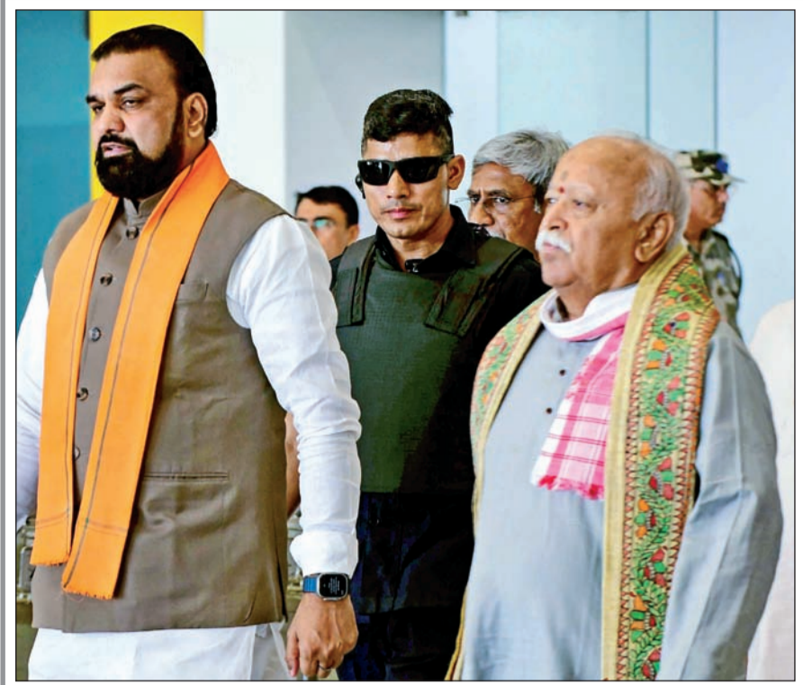
सरसंघचालक डॉ. मोहनजी भागवत यांचे रविवारी पाटणा विमानतळावर आगमन झाले. बिहारचे मुख्यमंत्री सम्राट चौधरी यांनी त्यांचे स्वागत केले

नागरिकांच्या आरोग्याशी खेळणाऱ्या कोणत्याही घटकाची ग्य केली जाणार नाही, असे स्पष्ट करत प्रशासनाने आता शून्य सहनशीलता (झीरो टॉलरन्स) धोरण स्वीकारले आहे. भारतीय न्याय संहिता आणि अन्न सुरक्षा मानके कायद्याच्या अंतर्गत गुन्हे दाखल करण्यात आल्यामुळे, दोषींवर आता कठोर कायदेशीर कारवाईचा फास आवळला जाणार आहे. भविष्यात या कारवाया अधिक तीव्रतेने आणि व्यापक स्तरावर सुरू राहणार असल्याचे संकेत प्रशासनाकडून देण्यात आले आहेत.