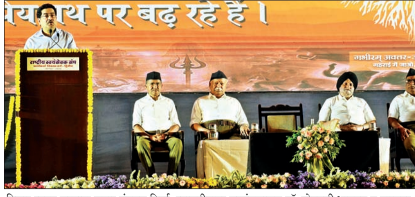
विचार व्यक्त करताना कुमार मंगलम बिरला. व्यासपीठावर सरसंघचालक डॉ. मोहनजी भागवत व मान्यवर

◆ नागपूर, ४ जून भारत सध्याच्या 'अमृतकाळ'त विकसित राष्ट्रकाडे वाटचाल करीत आहे. हा काळ भारतीय युवांसाठी अभूतपूर्व संधी घेऊन आला आहे. या सुवर्णसंधीचा लाभ घेत देशाच्या सर्वांगीण विकासात मोलाचे योगदान देण्याचे आव्हान प्रसिद्ध उद्योगपती व पद्मभूषण पुरस्काराने सन्मानित कुमार मंगलम बिरला यांनी युवकांना केले.