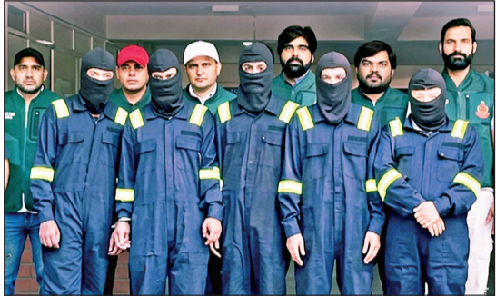
दिल्ली पोलिसांनी अटक केलेले दहशतवादी

वांद्रे स्थानकाजवळील गरीबनगर येथील अनधिकृत बांधकामे पाडण्यासाठी १९ ते २३ मे या कालावधीत राबवण्यात आलेल्या मोहिमेदरम्यान दहशतवाद्यांनी अतिक्रमण करून घेतले. यात पोलिसांसह १० जण जखमी झाले. गरीबनगर येथील अतिक्रमण हटाव मोहिमेची संघियतांनी पाहणी केली होती आणि पोलिसांच्या तैनातीचे व्हिडीओ व छायाचित्रे पाकिस्तानातील सूत्रधारांकडे पाठवली होती, अशी माहिती मुंबई पोलिसांच्या एका वरिष्ठ अधिकाऱ्याने रविवारी वृत्तस्थेला दिली.