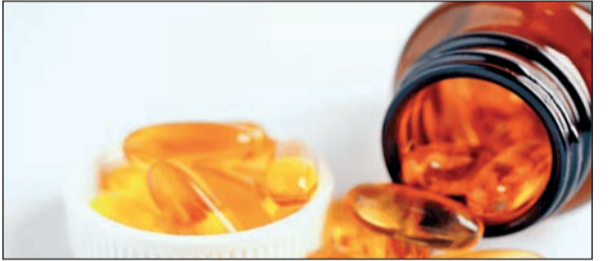
पामरीडॉक्सल-५ फॉस्फेट यांसारख्या महत्त्वाच्या जीवनसत्व आणि आरोग्यपूर्ण औषधांचा समावेश आहे. ही औषधे हाडांचे आरोग्य, व्हिटॅमिनची कमतरता आणि विविध न्यूरोलॉजिकल समस्यांवरील उपचारांमध्ये मोठ्या प्रमाणावर वापरली जातात. याशिवाय बिलास्टिन-मॉन्टेनुकास्ट टॅब्लेट, बिसोप्रोलोल फ्युमरेट, अँटोरवार्टिन आणि

◆ नवी दिल्ली, ३१ मे सामान्य नागरिकांना अत्यावश्यक औषधे योग्य आणि परवडणान्या दरात मिळावीत यासाठी राष्ट्रीय औषध किंमत प्राधिकरणाने महत्त्वाचा निर्णय घेतला आहे. प्राधिकरणाने एकूण ३० औषधांच्या कमाल किंमती निश्चित केल्या असून त्या तात्काळ लागू करण्यात आल्या आहेत. या निर्णयामुळे औषध बाजारात पारदर्शिता वाढण्यासोबतच रुग्णांच्या खाश्यावरील भार कमी होण्याची अपेक्षा व्यक्त केली जात आहे. २७ मे २०२६ रोजी जारी करण्यात आलेल्या आदेशात व्हिटॅमिन डी, कॅल्शियम, मिथाइलकोबालामिन, एल-मिथाइलफोलेट कॅल्शियम,