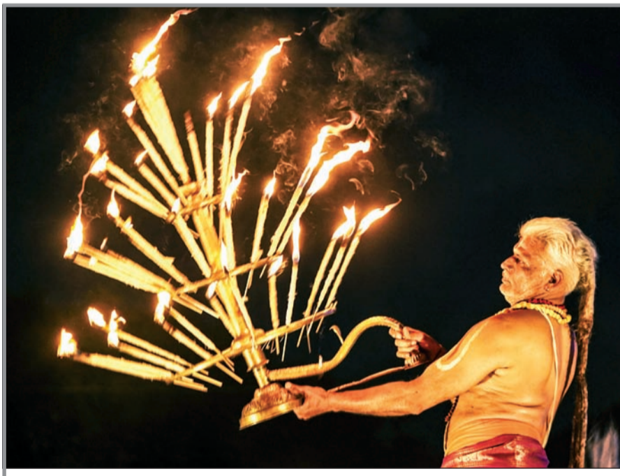
राजस्थानच्या अजमेर जिल्ह्यातील पुष्कर येथे अधिक मासातील पौर्णिमेनिमित्त महाआरती करताना पुजारी

डेहराडून : उत्तराखंडमध्ये गेल्या काही दिवसांपासून बदललेल्या हवामानाने संपूर्ण पर्वतीय भागात भीतीचे वातावरण निर्माण केले आहे. मुसळधार पाऊस, भूस्खलन आणि रस्त्यांची दुरवस्था यामुळे प्रसिद्ध केदारनाथ यात्रा तात्पुरती स्थगित करण्यात आली आहे. रुद्रप्रयाग जिल्हा प्रशासनाने सुरक्षेच्या कारणास्तव हा निर्णय घेतल्याने अनेक भाविक विविध मार्गांवर अडकले आहेत. हवामान विभागाने राज्यात ऑरेंज अलर्ट जारी केला असून, सततचा पाऊस आणि डोंगराळ भागात होणारे भूस्खलन यामुळे परिस्थिती अधिक गंभीर झाली आहे. प्रशासनाने यात्रेकरूनंना सुरक्षित ठिकाणी थांबण्याचे आवाहन केले असून हेल्योप्टर क्रमांकीही जारी केले आहेत. आपत्कालीन मदतीसाठी ११२ वर संपर्क साधण्याची सुविधा देण्यात आली आहे. ■