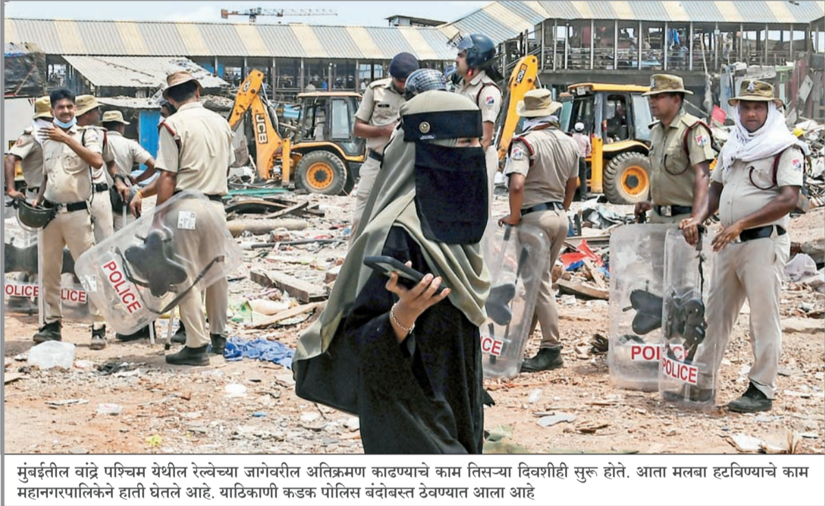
मुंबईतील वांद्रे पश्चिम येथील रेल्वेच्या जागेवरील अतिक्रमण काढण्याचे काम तिसऱ्या दिवशीही सुरू होते. आता मलबा हटविण्याचे काम महानगरपालिकेने हाती घेतले आहे. याठिकाणी कडक पोलिस बंदोबस्त ठेवण्यात आला आहे.

◆ ठाणे : उल्हासनगर कॅम्प- ५ मधील कैलास कॉलनी परिसरात झालेल्या गोळीबाराच्या घटनेने परिसरात खळबळ उडाली आहे. या घटनेत दोन जणांचा मृत्यू झाला आहे, तर एक जण गंभीर जखमी झाला आहे. प्राथमिक माहितीनुसार, जुन्या वैश्यातून दोन गट आमोसमोर आले आणि त्यानंतर हा हिंसक प्रकार घडला. या गोळीबारात सुमारे सात राउंड फायरिंग झाल्याचे सांगितले जात आहे. अचानक घडलेल्या या घटनेमुळे परिसरात भीतीचे वातावरण निर्माण झाले आहे.