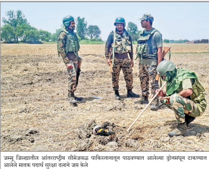
जम्मू जिल्ह्यातील आंतरराष्ट्रीय सीमेजवळ पाकिस्तानातून पाठवण्यात आलेल्या ड्रोनमधून टाकण्यात आलेले मावक पदार्थ सुरक्षा दलाने जप्त केले