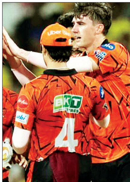
पॅट कमिन्सचे ३ बळी

चेन्नई सुपर किंग्साचा कर्णधार ऋतुराज गायकवाडने नाणेफेक जिंकले आणि विजय मिळविण्याचे ध्येय ठेवून घरच्या मैदानावर हैदराबादविरुद्ध प्रथम फलंदाजी करण्याचा निर्णय घेतला, परंतु अपेक्षेनुसार सज्ज सॅमसन व ऋतुराज गायकवाड या सलामीची जोडीची फलंदाजी हवी तशी बहरली नाही. पॅट कमिन्सच्या प्रभावी गोलंदाजीने सॅमसन, कार्तिक आणि गायकवाडला तंबूचा रस्ता दाखविला. सामन्याच्या तिसऱ्याच षटकात पॅट कमिन्सने वेगवान मारा करून सज्ज सॅमसनला ईशान किशनकडे झेल सोपविण्यास भाग पाडले. सॅमसनने १३ चेंडूत ५ चौकार व एका षटकाराच्या मदतीने २७ धावा केल्या. पुढे ऋतुराज गायकवाडने उर्विल पटेल व कार्तिक त्यागीच्या सहकार्याने संघाची धावसंख्या वाढविण्याचा प्रयत्न केला, परंतु साकिब हुसेनने