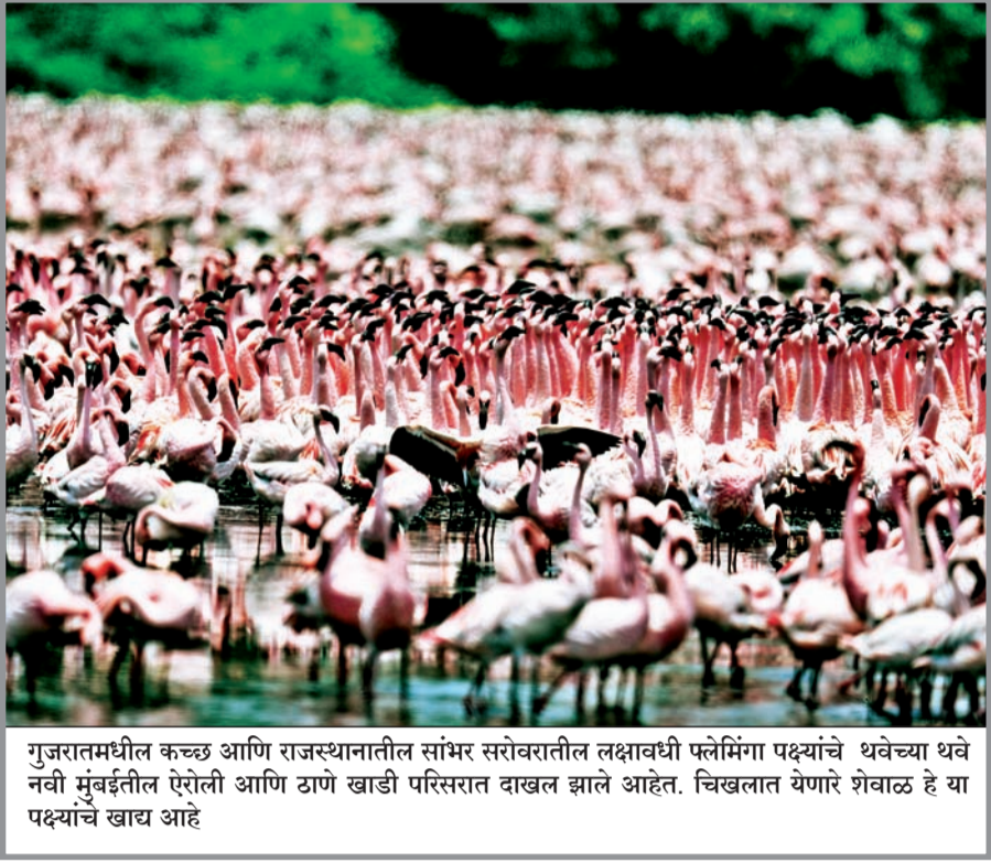
गुजरातमधील कच्छ आणि राजस्थानातील सांभर सरोवरातील लक्षावधी फ्लेमिंगा पक्ष्यांचे थवेच्या थवे नवी मुंबईतील ऐरोली आणि ठाणे खाडी परिसरात दाखल झाले आहेत. चिखलगत येणारे शेवाळ हे या पक्ष्यांचे खाद्य आहे