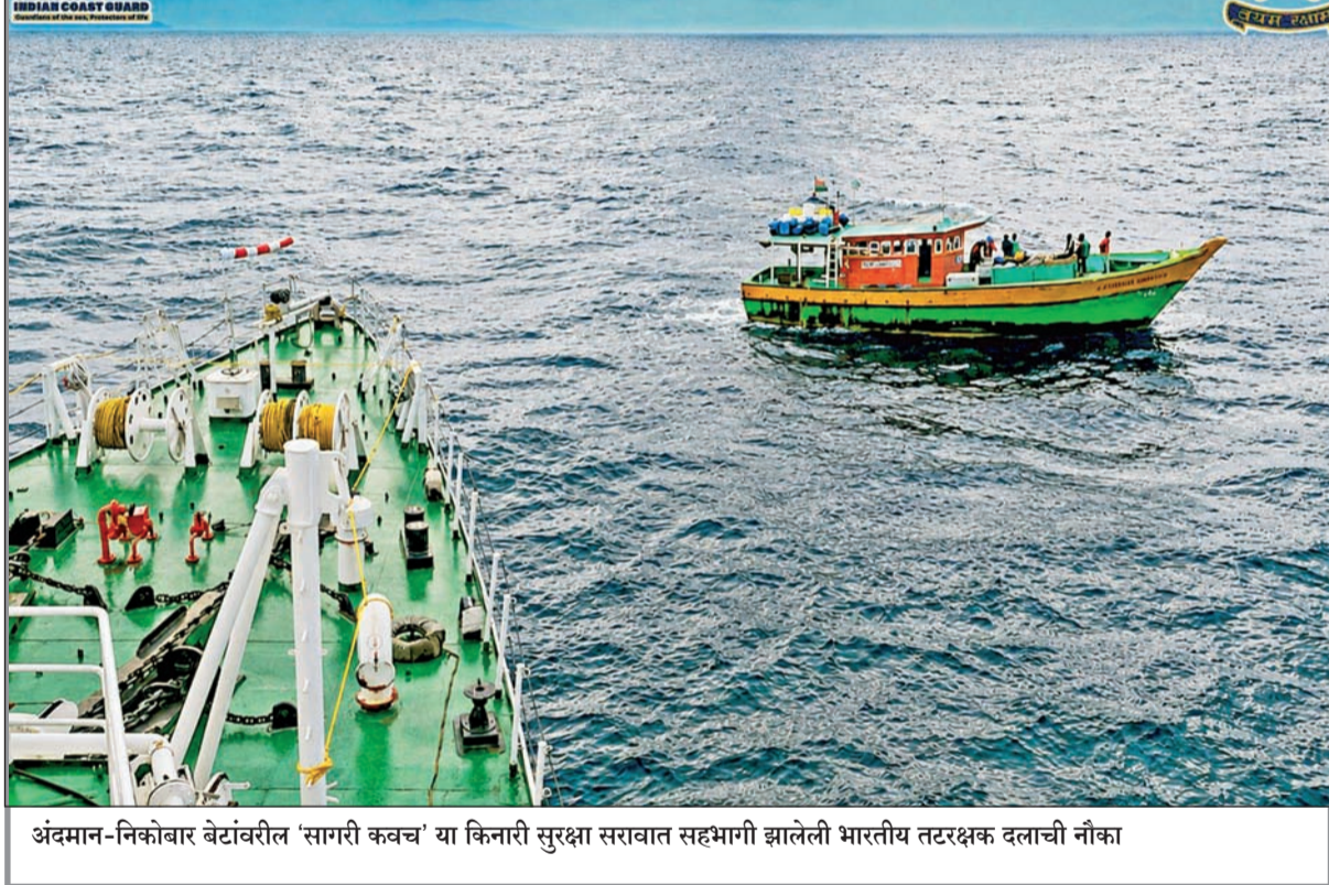
अंदमान-निकोबार बेटांवरील 'सागरी कवच' या किनारी सुरक्षा सरावात सहभागी झालेली भारतीय तटरक्षक दलाची नौका

मुंबई : सध्या चित्रपटगृहांमध्ये अभिनेता आणि दिग्दर्शक रितेश देशमुख यांचा 'राजा शिवाजी' चित्रपट गाजत आहे. साधारणपणे बॉक्स ऑफिसवर चांगली कमाई करणाऱ्या चित्रपटांना ओटीटीवर येण्यासाठी ४५ ते ६० दिवसांचा कालावधी लागतो. मात्र, या चित्रपटाच्या बाबतीत अद्याप अधिकृत घोषणा करण्यात आलेली नाही. दरम्यान, हा आता थेट जिओ हॉटस्टारवर स्ट्रीम केला जाण्याची शक्यता आहे. मात्र, याबाबत अधिकृत दुजोरा अद्याप मिळालेला नाही. प्रदर्शनाची तारीखही निश्चित करण्यात आलेली नाही. चित्रपटगृहांमध्ये 'राजा शिवाजी' मराठी आणि हिंदी भाषेत प्रदर्शित करण्यात आला आहे. मात्र, ओटीटीवर प्रदर्शित होताना हा चित्रपट पॅन इंडिया पाठविले जाऊ नये, अशी प्रार्थना आहे. याबाबत चित्रपट मराठी, हिंदी, गीतळ, तेलुगू, कन्नड आणि मल्याळम अशा सहा भाषांमध्ये उपलब्ध होऊ शकतो.