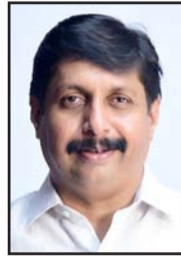
डीपीआर अहवालानुसार पुढील कार्यवाही करणार असल्याचेही नमूद केले होते. पंढरपूर हे देशातील प्रमुख तीर्थक्षेत्रांपैकी एक असून आपाढी व कार्तिकी वारीदरम्यान लाखो भाविक येथे येतात. तसेच हा मार्ग एनएच-६५ आणि एनएच-१६५ यांना जोडणारा महत्वाचा दुवा आहे. अनेक गाव, बाजारपेठा आणि साखर कारखान्यांसाठीही अत्यंत महत्वाचा आहे. महामार्गाच्या चौपटरीकरणामुळे वाहतूक सुलभ होऊन अपघातांचे प्रमाण कमी होण्यास मोठी मदत होणार आहे. खासदार धैर्यशील मोहिते-पाटील यांच्या पाठपुराव्यामुळे या महत्वाच्या प्रकल्पाला चालना मिळाल्याने माडा लोकसभा मतदारसंघातील नागरिकांमधून समाधान व्यक्त होत आहे.