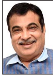
यामुळे हा मार्ग चौपटरीकरणाला मागणी त्यांनी दिल्ली येथे नितिन गडकरी यांना भेटून केली होती. मागणीची दखल घेत गडकरी यांनी खासदार धैर्यशील मोहिते-पाटील यांना पाठविलेल्या पत्रात टॅम्बुर्णी-पंढरपूर राष्ट्रीय महामार्गाच्या चौपटरीकरणाला डीपीआर (सविस्तर प्रकल्प अहवाल) तयार करण्यासाठी निविदा प्रक्रिया सुरु केल्याचे सांगितले होते.

खासदार धैर्यशील मोहिते-पाटील यांनी टॅम्बुर्णी ते पंढरपूर या राष्ट्रीय महामार्गाच्या चौपटरीकरणाला केंद्रीय मंत्री नितिन गडकरी यांच्याकडे सातत्याने पाठपुरावा केला होता. वाहतूक वाहतूक, वारकऱ्यांची मोठी संख्या, अपघातांचे वाढते प्रमाण आणि वाहतूक कोंडी