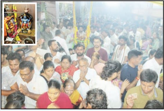
सोलापूर : सोलापूर शहरात शनि अमावस्येनिमित्त भाविकांनी शनी मंदिरात दर्शनासाठी गर्दी केली होती.