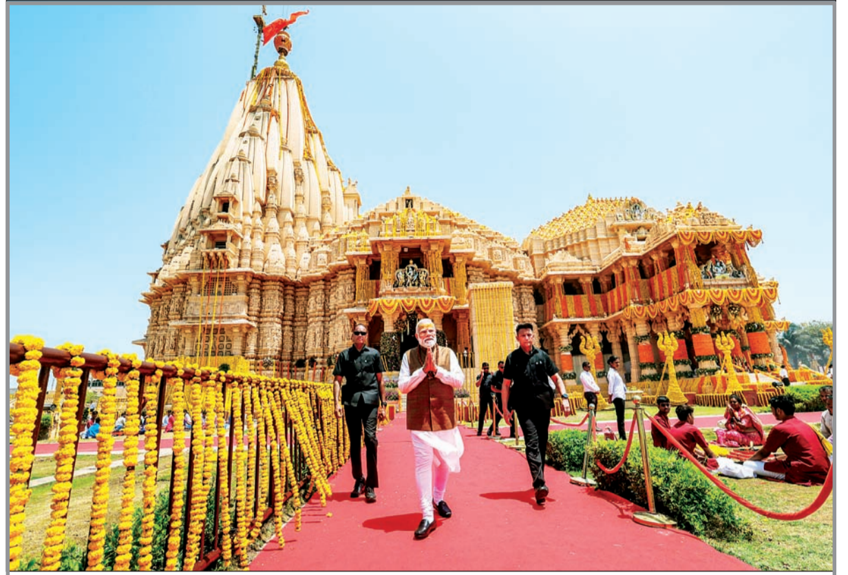
गुजरातमधील गौर सोमनाथ जिल्ह्यात असलेल्या प्रसिद्ध सोमनाथ मंदिराच्या जीर्णोद्धाराला ५५ वर्षे पूर्ण झालीत. सोमनाथ अमृत महोत्सवप्रसंगी पंतप्रधान नरेंद्र मोदी यांच्या हस्ते महापूजा आणि अनुष्ठान करण्यात आले. तसेच त्यांच्या हस्ते मंदिराच्या कळसाचा जलाभिषेक करण्यात आला. यासाठी ११ पवित्र ठिकाणांहून जल आणले

इराणचा प्रस्ताव फेटाळताना ट्रम्प यांनी अशा तपशीलांचा कोणताही उल्लेख केला नाही. अमेरिका इराणच्या समृद्ध युरेनियम साठ्यावर बाराकॉडनी लक्ष ठेवून आहे तसेच जर कोणी त्या ठिकाणाजवळ जाण्याचा प्रयत्न केला, तर अमेरिकेला त्याची तत्काळ कल्पना येईल आणि असा प्रयत्न उधळला जाईल, असे ट्रम्प यांनी एका पत्रकारासोबत चर्चा करताना सांगितले. ◀(वृत्तसंस्था)