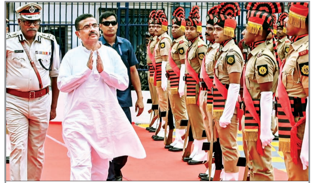
पश्चिम बंगालचे मुख्यमंत्री शुभेन्द्र अधिकारी यांनी पद्मभार स्वीकारताच धडाकेबाज निर्णय घेण्यास सुरुवात केली. शपथ घेतलेल्या मंत्र्यांना खातेवाटप केल्यानंतर कॅबिनेटची पहिली बैठक पार पडली. या बैठकीसाठी मंत्रालयात येताना मुख्यमंत्री अधिकारी