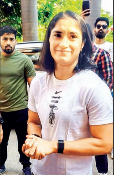
उत्तर प्रदेशच्या गोंडा येथील राष्ट्रीय रॅकिंग कुस्ती स्पर्धेमध्ये दाखल झालेली विनेश फोगट

♦ नवी दिल्ली, ११ मे मी राष्ट्रीय रॅकिंग कुस्ती स्पर्धेत सहभागी होण्यास पात्र आहे. भारतीय कुस्ती महासंघाने माझ्या विश्रांतीचा कालावधी व पुनरागमनबाबत चुकीचा अर्थ लावला आहे, असे ऑलिम्पिकनट कुस्तीगीर विनेश फोगट हिने म्हटले आहे. आपल्या कायदेशीर पथक व सल्लागारांशी चर्चा केल्यानंतर, नोटीसमध्ये करण्यात आलेल्या प्रत्येक दाव्याला मी पुढील चौदा दिवसांत सविस्तर उत्तर देईल, असेही हरयाणाच्या ३१ वर्षीय कुस्तीपटूने नमूद केले आहे. आशियाई क्रीडा स्पर्धेतील सुवर्णपदक विजेती विनेश हिला भारतीय कुस्ती महासंघाकडून १५ पानांची कारणे दाखवा नोटीस बजावण्यात आली होती. या नोटीसमध्ये तिच्यावर बेशिस्तपणाचा व उत्तेजक-विरोधी नियमांचे उल्लंघन केल्याचा आरोप करण्यात आला होता; तसेच तिला २६ जूनपर्यंत देशांतर्गत स्पर्धांमध्ये सहभागी होण्यास अपात्र घोषित करण्यात आले होते. पॅरिस ऑलिम्पिकनंतर घेतलेल्या विश्रांतीनंतर, नंदिनीनगर महाविद्यालयाच्या आवारात सुरू असलेल्या राष्ट्रीय वरिष्ठ गट मानांकन कुस्ती स्पर्धेतील ५७ किलो वजनी गटात पुन्हा स्पर्धात्मक कुस्तीमध्ये परतण्याचा विनेशचा प्रयत्न होता, परंतु तो या निर्णयामुळे हाणून पाडला गेला. या १५ दिवसांच्या कारणे दाखवा नोटीसमध्ये महासंघाने एका महत्त्वाच्या मुद्द्यावर प्रकाश टाकला आहे. तो मुद्दा म्हणजे, पॅरिस ऑलिम्पिकमध्ये ५० किलो वजनी गटाच्या अंतिम फेरीत पोहोचल्यानंतर दुसऱ्याच दिवशी विनेशला