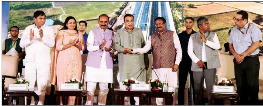
मुंडका बक्करवाला येथे देशातील दुसऱ्या मल्टिलेन फ्री फ्लो टोल प्लाझाचे लोकार्पण करताना नितीन गडकरी

◆ नवी दिल्ली, ११ मे यावर्षीच्या अखेरीस म्हणजे डिसेंबरपर्यंत देशातील पारंपरिक टोल प्लाजा हटवण्याची आणि उपग्रह आधारित टोल वसुली प्रणाली देशभर लागू करण्याची महत्त्वपूर्ण घोषणा केंद्रीय भूपृष्ठ परिवहन आणि महामार्ग मंत्री नितीन गडकरी यांनी सोमवारी केली.