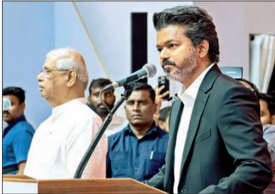
सी जोसेफ विजय यांना शपथ देताना राज्यपाल राजेंद्र आर्लेकर

तामिळनाडूत एक नवीन शासनव्यवस्था सुरू झाली आहे