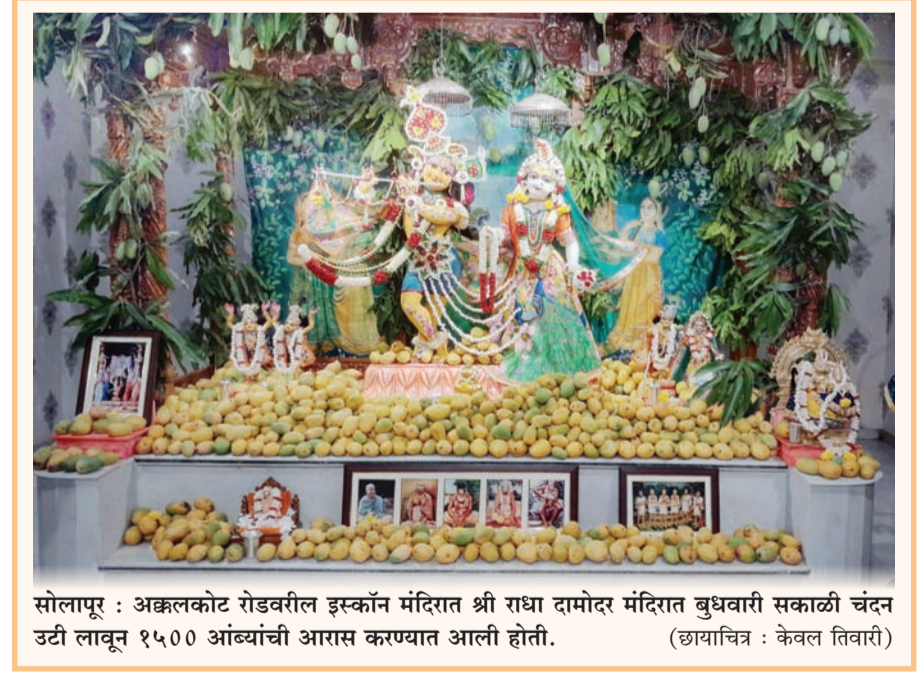
सोलापूर : अक्कलकोट रोडवरील इस्कॉन मंदिरात श्री राधा दामोदर मंदिरात बुधवारी सकाळी चंद्र उडी लावून १५,०० आंब्यांची आरास करण्यात आली होती.