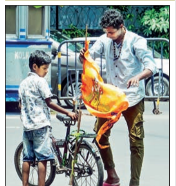
सत्ता बदलानंतर पश्चिम बंगालमधील सामाजिक वातावरणाने मुक्त रूपास घेतला. भगवा ध्वज घेऊन फिरताना कोलकाता शहरातील चिमुकला