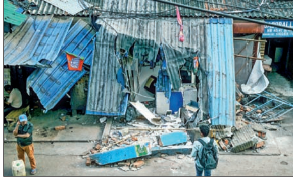
कोलकाता येथे उद्ध्वस्त करण्यात आलेले तुणमूलचे कार्यालय