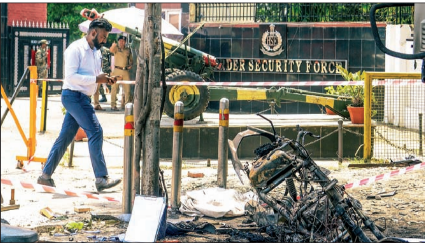
घटनास्थळाची पाहणी करताना फॉरेंसिक विभागाचा अधिकारी

पंजाबमध्ये एका पाठोपाठ झालेल्या दोन स्फोटांमुळे पोलिस आणि सुरक्षा यंत्रणांची काळजी वाढली आहे. जालंधर आणि अमृतसरमधील बीएसएफ आणि लष्कराशी संबंधित परिसरात झालेल्या या स्फोटांमुळे येथे दहशतवादाचे मोठे मांड्युल सक्रिय झाल्याची भीती आहे. स्फोटांमार्गे आयएसआयचा कट आणि खलिस्तानी संबंध प्राथमिक तपासात आढळला आहे. या प्रकरणाचा तपास एनआयएकडे सोपवण्यात आला.