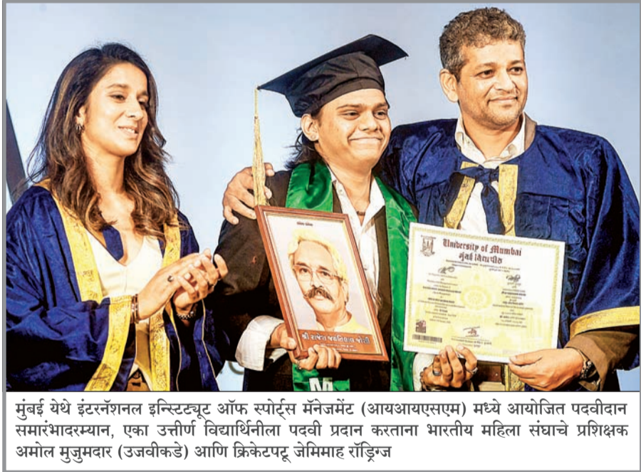
मुंबई येथे इंटरनॅशनल इन्स्टिट्यूट ऑफ स्पोर्ट्स मॅनेजमेंट (आयआयएसएम) मध्ये आयोजित पदवीदान समारंभादरम्यान, एका उत्तीर्ण विद्यार्थिनीला पदवी प्रदान करताना भारतीय महिला संघाचे प्रशिक्षक अमोल मुजुमदार (उजवीकडे) आणि क्रिकेटपटू जेमिमाह रॉड्रिग्स

आयपीएल प्ले-ऑफच्या शर्यतीत टिकून राहण्याची त्यांची आशा आता जवळपास संपुष्टात आली असली, तरीही पात्र ठरण्याची एक पुसटशी शक्यता अजूनही शिल्लक आहे.पण त्याआधी, मुंबई इंडियन्सला त्यांच्या भारतीय खेळाडूंची संघाची मुख्य धुरा सांभाळणे गरजेचे आहे, जी गोष्ट आतापर्यंत घडलेली नाही. (वृत्तसंस्था)