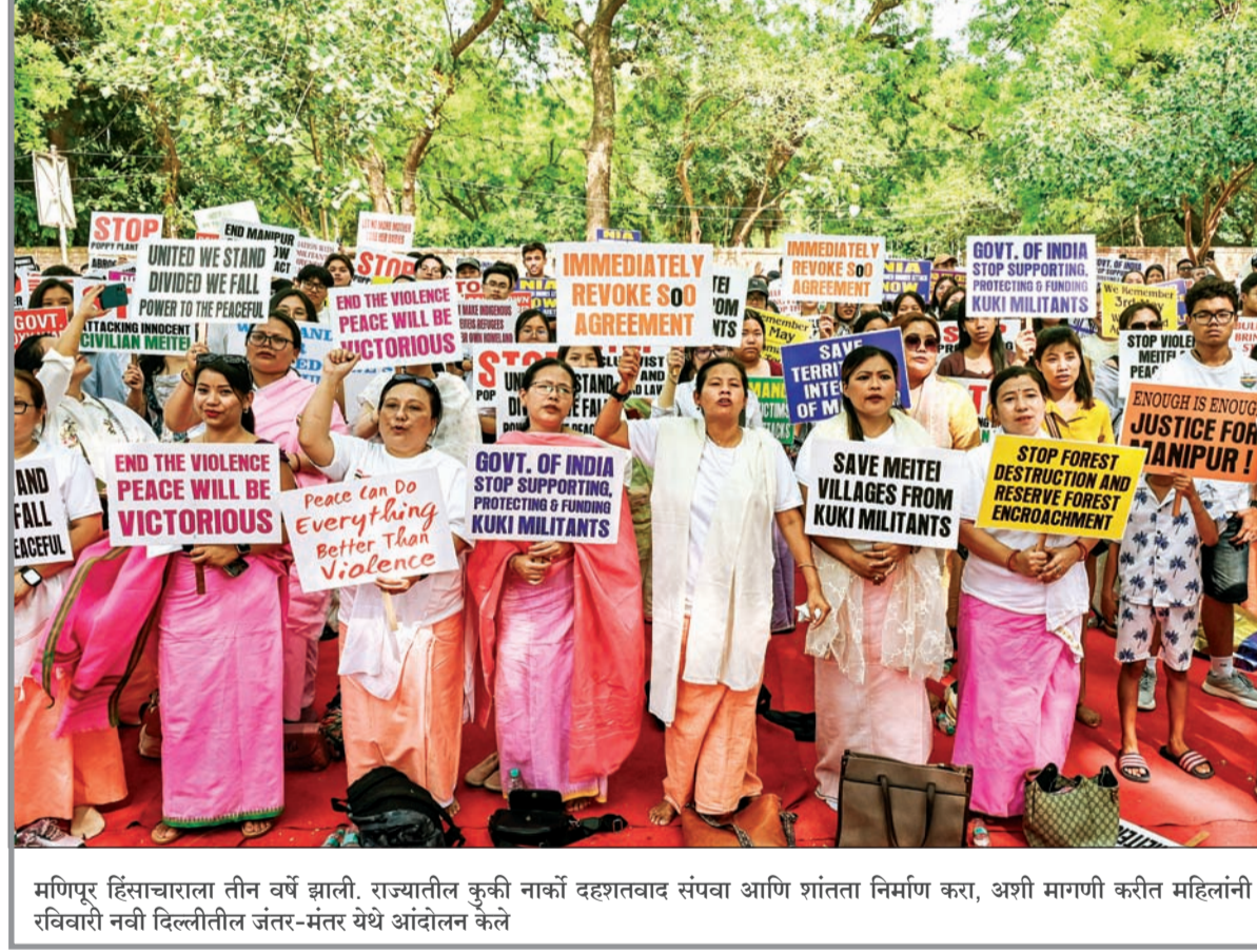
मणिपूर हिंसाचाराला तीन वर्षे झाली. राज्यातील कुकी नाकां दहशतवाद संपवा आणि शांतता निर्माण करा, अशी मागणी करीत महिलांनी रविवारी नवी दिल्लीतील जंतर-मंतर येथे आंदोलन केले