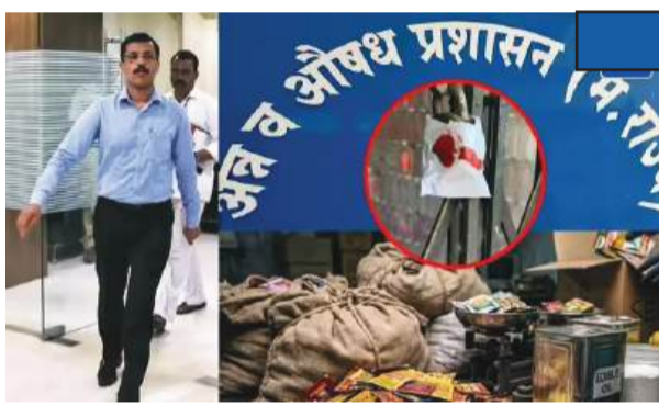
बृहन्मुंबई, कोकण, पुणे, नाशिक, अमरावती, नागपूर आणि छत्रपती संभाजीनगर विभागांत कारवाया करण्यात आल्या. राज्यातील ५३ आस्थापनांची तपासणी करण्यात आली. त्यापैकी ३४ ठिकाणी नियमभंग आढळून