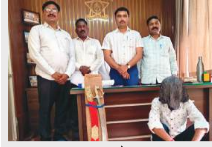
तथा वृत्तसेवा जालना । प्रतिनिधी

अवैधपणे शस्त्र बाळगून दहशत माजविणाऱ्या प्रवृत्तीविरोधात सुरू असलेल्या मोहिमेअंतर्गत जालना पोलिसांच्या दहशतवाद विरोधी पथकाने एक महत्त्वपूर्ण कारवाई करत ऑनलाईन पद्धतीने तलवार मागविणाऱ्या युवकास अटक केली असून त्याच्याकडून एक तलवार जप्त करण्यात आली आहे.