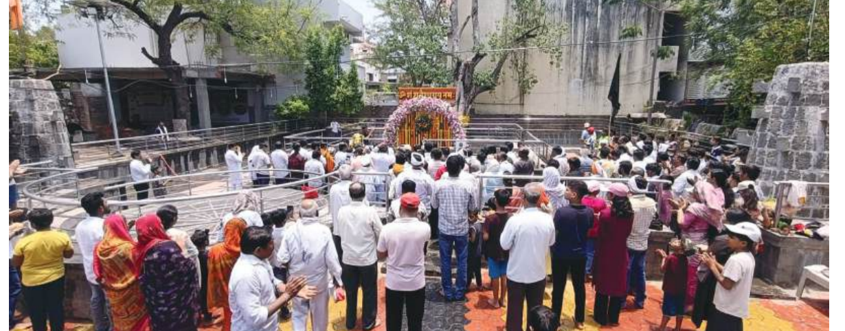
शनी जन्मोत्सव भक्तानी उत्साह साजरा केला दि. 16 रोज शनिवार रोजी बीड येथील शनी मंदिरात भक्तानी दर्शनाचा लाभ घेतला.