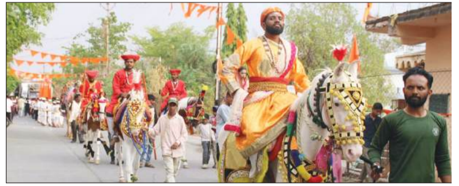
हिंगोली- छावाच्यावतीने धर्मवीर छत्रपती संभाजी महाराज यांच्या जयंतीनिमित्त शहरातून भव्य मिरवणूक काढण्यात आली होती.