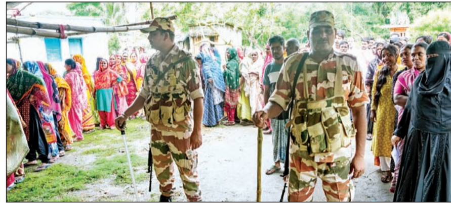
फेरमतदानाच्यावेळी गडबड होऊ नये म्हणून तैनात करण्यात आलेले अर्धसैनिक दलाचे जवान