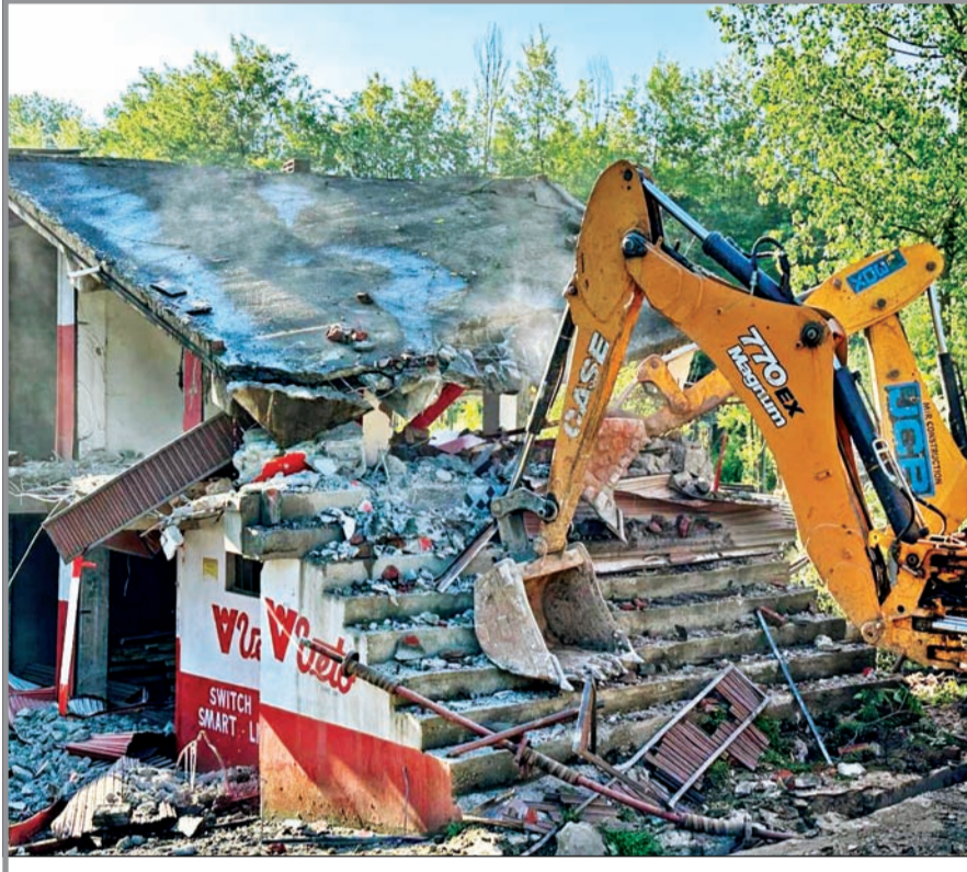
जम्मू-काश्मीरमध्ये स्थानिक प्रशासनाने मादक पदार्थांची विक्री आणि साठवणूक करणाऱ्यांविरुद्ध मोहीम उघडली आहे. या अवैध व्यापारात गुंतलेल्या आरोपींचे घर आणि दुकाने भुईसपाट केली जात आहेत