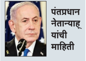
पंतप्रधान नेतान्याह यांची माहिती

● लष्कराचे राहणार नियंत्रण ● विरोध केल्यास हकालपट्टी