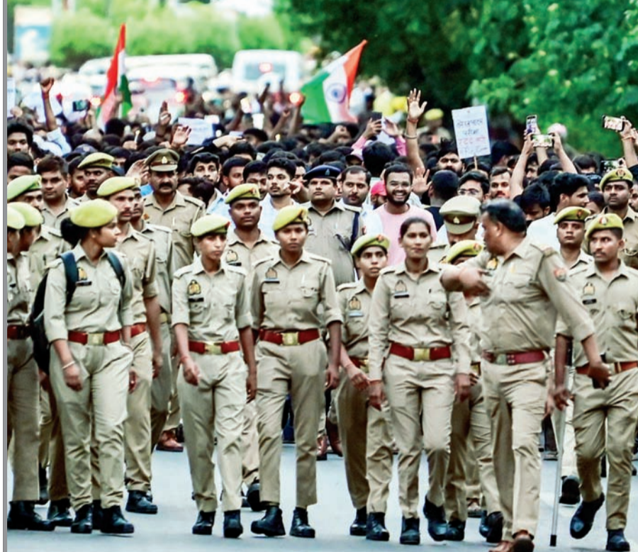
उत्तर प्रदेशातील प्रयागराज येथे, नीट-यूजी परीक्षा आणि लेखपाल भरती प्रक्रियेतील कथित पेपरफूट आणि अनियमिततेच्या निषेधार्थ सुरू असलेल्या आंदोलनाच्या पृष्ठभूमीवर अनुचित घटना टाळण्यासाठी पोलिसांचा कडेकोट बंदोबस्त तैनात करण्यात आला.

सील ठोकण्यात आले आहे. या सर्व ठिकाणी गुटखा, पानमसाला आणि तंबाखूजन्य पदार्थांचा बेकायदेशीर साठा आणि विक्री आढळून आली. संबंधित १९ व्यक्तींविरुद्ध गुन्हे दाखल करून त्यांना अटक करण्यात आली आहे. गुटखा आणि पानमसाल्याव्यतिरिक्त अन्न व औषध प्रशासनाने इतर २३ आस्थापनांचीही तपासणी केली आहे. यामध्ये पॅकबंद पाणी, दूध, तेल, मसाले, फ्रसपाण, आईसक्रीम, नूप, पनीर, खवा आणि बेकरी पदार्थ यांसारख्या दैनंदिन वापरातील अन्नपदार्थांचा समावेश होता. ◀(वृत्तसंस्था)