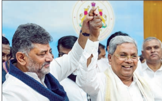
पत्रकार परिषदेत सिद्धरामय्या आणि डी. के. शिवकुमार यांनी हातात हात घेऊन काँग्रेसमध्ये आलबेल असल्याचे संकेत दिले