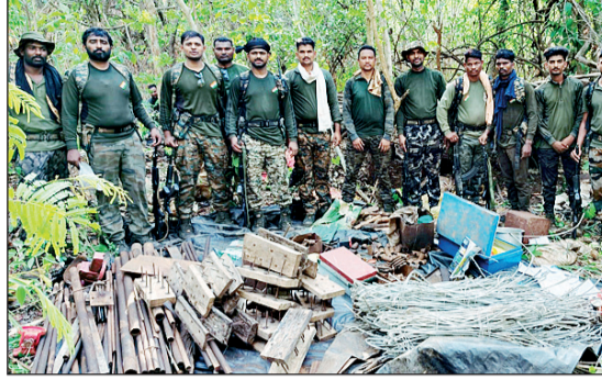
जप्त करण्यात आलेले शस्त्रनिर्मिती साहित्य

गडचिरोली, २८ मे - नारायणपूर पोलिसांच्या संयुक्त आंतरराष्ट्रीय अभियानात माओवाद्यांचा शस्त्रनिर्मिती कारखाना उद्ध्वस्त करण्यात आला असून, मोठ्या प्रमाणात शस्त्रसाठा आणि स्फोटक साहित्य जप्त करण्यात आले. आत्मसमर्पित माओवाद्यांकडून मिळालेल्या गोपनीय माहितीच्या आधारे ही कारवाई करण्यात आली. ऑपरेशन 'अंतिम प्रहार' अंतर्गत राबविण्यात आलेल्या या मोहिमेत १ इन्सास रायफल, २ सिंगल शॉट रायफल, २ बारा बोर रायफल आणि १८ जिवंत काडबुसे जप्त करण्यात आली. तसेच २५ किलो आयईडी स्फोटक, २ क्लेमोर, ११० डेटोनेटर, कॉर्टेक्स वायर, ५०० पेक्षा अधिक बीजीएल सेल, ७