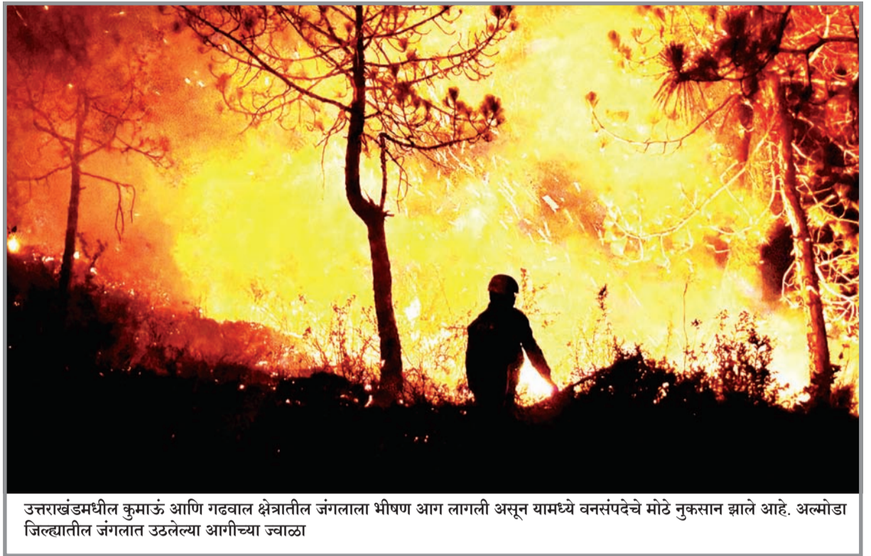
उत्तराखंडमधील कुमाऊं आणि गढवाल क्षेत्रातील जंगलाला भीषण आग लागली असून यामध्ये वनसंपदेचे मोठे नुकसान झाले आहे. अल्मोडा जिल्ह्यातील जंगलात उडलेल्या आगीच्या ज्वाळा

म्हणून त्यांच्या निःपक्षपातीपणावर गंभीर शंका आहे. पाकिस्तानी अधिकाऱ्यांचे इसापलविरोधातील टिप्पणी जगाजारी आहेत. ही बाब चिंताजनक असून, पाकिस्तानला मध्यस्थ बनवणे हे स्पष्टपणे समस्येप्रधान आहे. अब्राहम करारात पुन्हा सामील होण्याच्या ट्रम्प यांच्या आवाहनावर पाकिस्तानने तत्काळ आपली अधिकृत भूमिका स्पष्ट करावी, अशी मागणी त्यांनी केली.