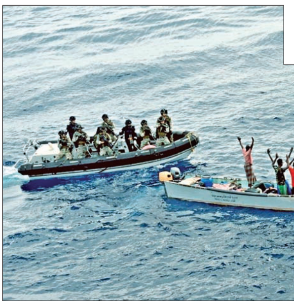
पाटलाग केल्यानंतर भारतीय नौदलाने समुद्री चाच्यांच्या बोटीवर नियंत्रण मिळविले

मुंबई : थिएटर आणि डिजिटलवर मिळालेल्या अफाट यशानंतर आमिर खान अभिनीत 'सितारे जमीन पर' आता वर्ल्ड टेलिव्हिजन प्रीमियरसाठी सज्ज आहे. हा चित्रपट ३१ मे रोजी दुपारी १ वाजता सोनी मॅक्सवर प्रेक्षकांच्या भेटीला येणार आहे. आनंद, हशा आणि भावना यांनी भरलेला हा चित्रपट देशभरातील कुटुंबांना एकत्र आणून घरबसल्या एक हृदयस्पर्शी अनुभव देणार आहे. या चित्रपटात आमिर खान गुलशनच्या भूमिकेत असून, जेनेलिया देशमुख, गुलशनची पत्नी सुनीताच्या भूमिकेत आहे.