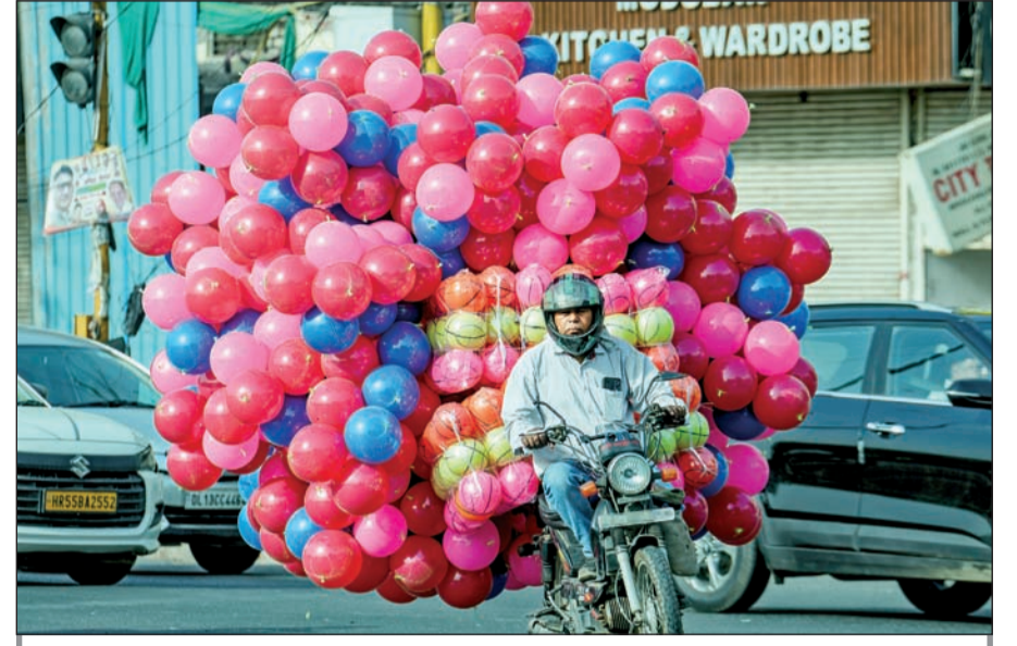
संगीबेरींगी चेंडू आणि फुगे लहान मुलांच्या आकर्षणाचे केंद्र तर दुसरीकडे ते कुणासाठी भाकरीचा आधार असतात. कारण, दररोजची भूक त्यांच्या विक्रीवरच भागवली जाते. दिल्लीत दुचाकीवर चेंडू घेऊन जात असलेला विक्रेता