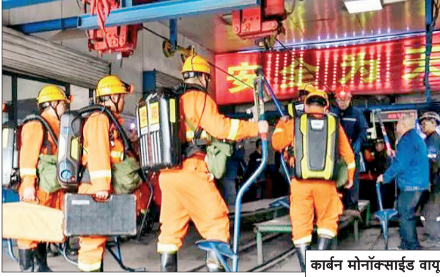
बचाव अभियानादरम्यान, शनिवारी

जमिनीखाली असलेल्या खाणीत उत्खननाचे काम सुरू असताना स्फोट झाल्याचे वृत्तसंस्थेने एका अधिकाऱ्याने दिलेल्या माहितीच्या आधारे दिली आहे. रात्रभर सुरू असलेल्या