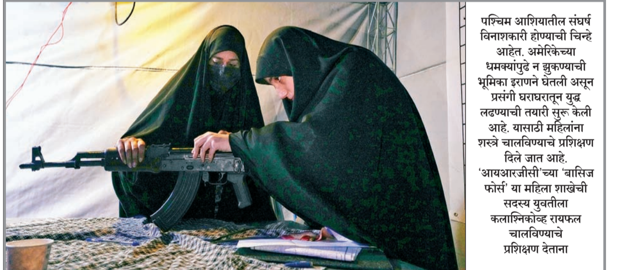
पश्चिम आशियातील संघर्ष विनाशकारी होण्याची चिन्हे आहेत. अमेरिकेच्या धमक्यांपुढे न झुकण्याची भूमिका इराणने घेतली असून प्रसंगी धरारचतून युद्ध लढण्याची तयारी सुरु केली आहे. यासाठी महिल्लांना शस्त्रे चालविण्याचे प्रशिक्षण दिले जात आहे. 'आयआरजीसी'च्या 'बासिज फोर्स' या महिला शाखेची सदस्य युवतीला कलात्मिकदृष्ट्या रायफल चालविण्याचे प्रशिक्षण देताना

कर्मचाऱ्यांचे भविष्य लक्षात घेता, जनहिताला प्राधान्य दिले पाहिजे, असा युक्तिवादही त्यांनी केला. सर्वोच्च न्यायालयाने मुदत देण्यास नकार देत एअरलाइनला उच्च न्यायालयात जाण्याचा सल्ला दिला. न्यायालयाने नमूद केले की, मे महिन्यात जाहीर झालेली सरकारी योजना किंवा पश्चिम आशियातील संकट हे मुदतवादीसाठीचे कारण ठरू शकत नाही. ▲(वृत्तसंस्था)