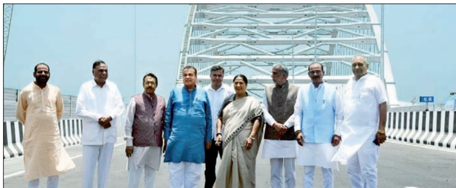
यासाठी दिल्ली आणि परिसरात एक्सप्रेसवे, सिंग रोड, बोगदे (टनेल), आणि एलिव्हेटेड कोरिडॉर मोठ्या प्रमाणात बनवले जात आहे.