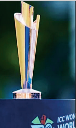
बर्मिंगहाममधील ऐतिहासिक एजबॅस्टन क्रिकेट मैदानावर श्रीलंकेची सलामीच्या सामन्यात होईल. ही स्पर्धा

◆ नवी दिल्ली, १७ मे आयसीसी महिला टी-२० विश्वचषक २०२६ क्रिकेट स्पर्धेसाठी उलटपत्तनती सुरू झाले आहे, आणि यंदा ही स्पर्धा पूर्वीपेक्षा अधिक मोठी आणि रोमांचक होणार आहे. पहिल्यांदाच, १२ संघ विजेतेपदासाठी स्पर्धा करतील. विशेष म्हणजे, क्रिकेटची पढरी मानल्या जाणाऱ्या इंग्लंडमध्ये ही स्पर्धा जून-जुलै दरम्यान आयोजित केली जाईल. नऊ देशांनी आपले संघ जाहीर केले आहेत, तर तीन देशांच्या संघांची घोषणा होणे शिल्लक आहे. महिला टी-२० विश्वचषक स्पर्धा १२ जून रोजी सुरुवात होईल. यजमान इंग्लंडचा सामना