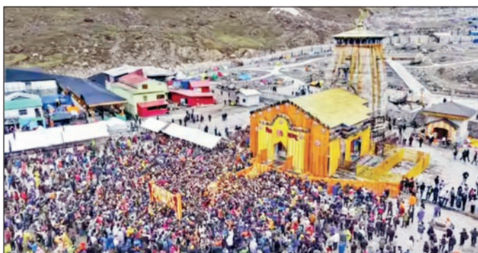
स्वरूप बिघडत आहे. धामची मर्यादा, प्रवासी आणि व्यापाऱ्यांच्या सुविधांवर

परिणाम होत आहे. २५ दिवसांत विक्रमी ५.५० लाखापेक्षा जास्त भाविक येऊन