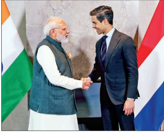
रॉब जेटेन यांच्यासोबत हस्तांदोलन करताना पंतप्रधान नरेंद्र मोदी

शनिवारी सायंकाळी झालेल्या बैठकीत दोन्ही पंतप्रधानांनी पश्चिम आशियातील परिस्थितीबाबत विशेषतः जागतिक उर्जा पुरवठा आणि व्यापारात निर्माण झालेल्या व्यत्ययांमुळे त्या प्रदेशावर आणि त्या पलीकडे होणाऱ्या परिणामांबाबत गंभीर चिंता व्यक्त केली. मोदी आणि जेटेन यांनी हार्मोझिया सामुद्रधुनीतून स्वातंत्र्य आणि जागतिक व्यापाराचा मुक्त प्रवाह असावा, अशी मागणी केली तसेच कोणत्याही निर्बंधनात्मक उपाययोजनांना विरोध दर्शवत या संदर्भात सुरु असलेल्या उपक्रमांना पाठिंबा असल्याचा पुनरुच्चार केला. या दोन्ही नेत्यांनी युकेनमधील परिस्थितीवरही चर्चा केली. संयुक्त राष्ट्र संघ आणि आंतरराष्ट्रीय कायद्याच्या तत्वांवर आधारित राहून संवाद व भ्रूतसहयोगीय माध्यमातून युकेनमध्ये सर्वसमावेशक न्याय्य