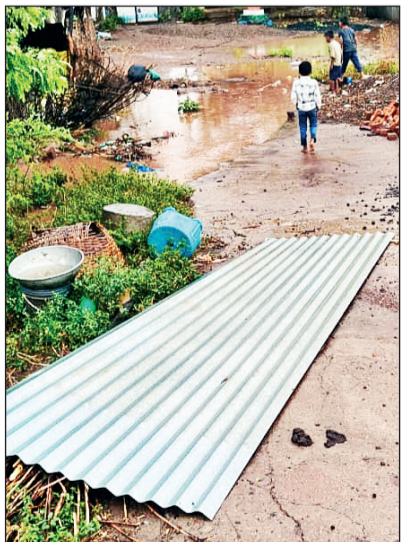
वादळात उडून गेलेला टिनपत्रा

अकोल्यात काही ठिकाणी गारपीट शहर आणि जिल्ह्यात ४६ अंशपेक्षा अधिक तापमानाचा तडाखा सहन करणाऱ्या अकोलेकरांना गुरुवारी दुपारी १ ते दीडच्या सुमारास अल्पकाळ आलेल्या पावसाने थोडा दिलासा दिला. जिल्ह्यात काही ठिकाणी गारपीट झाल्याचेही वृत्त आहे. दुपारी आभाळ दगांनी भरून आले व उन्हाचा तडाखा कमी झाल्याचे जाणवत असतानाच पावसाला सुरुवात झाली. (तथा वृत्तसेवा)