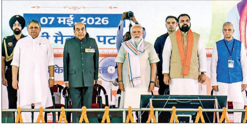
शपथविधी सोहळ्याला उपस्थित पंतप्रधान नरेंद्र मोदी, बिहारचे राज्यपाल सय्यद अता हसनैन, मुख्यमंत्री सम्राट चौधरी आणि इतर मान्यवर