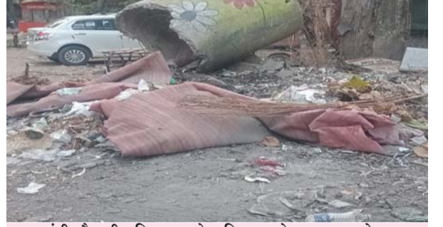
लातूर गांधी चौकातील जि. प. आरोग्य विभागाच्या गेटवर जमा झालेला कचरा