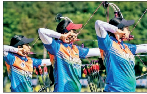
लक्ष्य साधताना भारतीय महिला तिरंदाज

येथे सुरू असलेल्या तिरंदाजी विश्वचषक (दुसरे चरण) स्पर्धेत भारतासाठी गुरुवारचा दिवस संमिश्र ठरला. एका बाजूला, महिलांच्या रिक्त स्थाने घेऊन उपांत्य फेरीत १० वेळा ऑलिंपिक विजेत्या ठरलेल्या दक्षिण कोरियाचा जबरदस्त पराभव करीत भारताचे पहिले पदक निश्चित केले; तर दुसऱ्या बाजूला, बांगलादेशकडून अनपेक्षित पराभव झाल्यामुळे पुरुष संघाला स्पर्धाबाहेर पडावे लागले. मिश्र संघ प्रकारातही भारताची मोहीम संपुष्टात आली. या प्रकारात धीरज बोम्मादेवरा व अंकिता भगत या जोडीला दुसऱ्या फेरीत ब्राझीलकडून पराभव पत्करावा