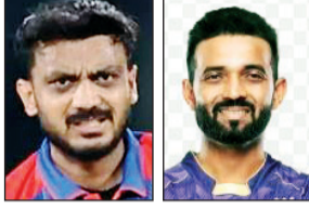
अक्षर पटेल अजिंक्य रहाणे

अक्षर पटेलच्या नेतृत्वाखालील दिल्ली कॅपिटल्स गुणतालिकेत ७व्या क्रमांकावर आहे; त्यांनी १० सामन्यांपैकी ४ सामने जिंकले असून ६ सामन्यांत त्यांना पराभवाचा सामना करावा लागला आहे. दुसरीकडे, अजिंक्य रहाणेच्या नेतृत्वाखालील कोलकाता नाईट रायडर्सने ९ सामन्यांत ३ विजय आणि ५ पराभव नोंदविले आहेत. तीन वेळा विजेतेपद पटकावलेला हा संघ सध्या गुणतालिकेत ८व्या क्रमांकावर आहे; मात्र, जर त्यांनी आपली विजयाची मालिका सलग चार सामन्यांपर्यंत वाढवली, तर ते