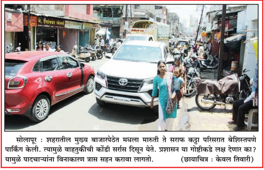
सोलापूर : शहरातील मुख्य बाजारपेठेत मधला मारुती ते सराफ कडू परिसरात बेशिस्तपणे पार्किंग केली. त्यामुळे वाहतूकीची कोंडी सर्रास दिसून येते. प्रशासन या गोष्टीकडे लक्ष देणार का? यामुळे पादचाऱ्यांना विनाकारण त्रास सहन करावा लागतो. (छायाचित्र : केवल तिवारी)

पाणी सोडणार असल्याचे सांगितले. झाडे मोठी असल्यामुळे या झाडांना पाणी दिल्यास पुन्हा पालखी फुटू शकते ही जळून जाणार नाहीत. परंतु तीन चार वेळा पाणी देणे आवश्यक असल्याचे माळशिरस वनक्षेत्रपाल आर्वटे यांनी सांगितले.