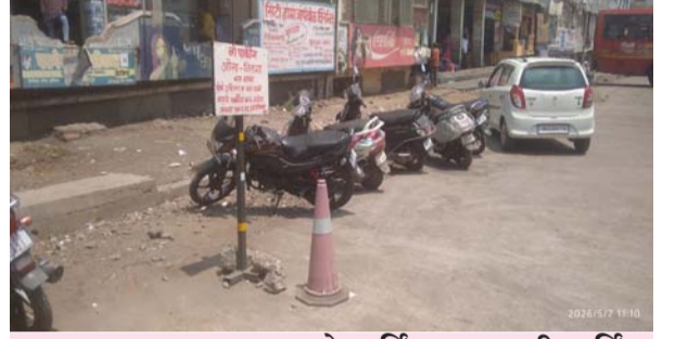
लातूर मुख्य बस्थानकात नो पार्किंगच्या जागी पार्किंग