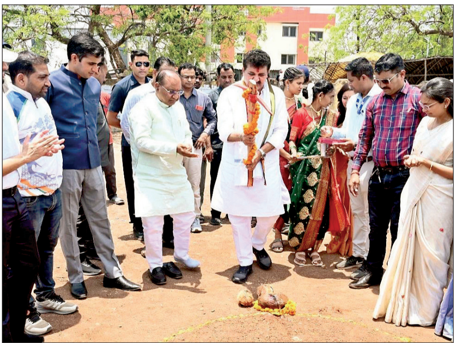
कुदळ मारून भूमिपूजन करताना मान्यवर

१७ वर्षाखालील महिला आशियाई चषक फुटबॉल स्पर्धेच्या उपांत्यपूर्व फेरीत स्थान मिळवण्याची भारताच्या १७ महिला संघासाठी ही शेवटची संधी असून त्याकरिता संघ सज्ज झाला आहे. शुक्रवारी सुझोऊ ताईहू फुटबॉल क्रीडा केंद्राच्या मैदानावर होणाऱ्या गट ब मधील शेवटच्या सामन्यात हा संघ लेबॉननचा सामना करेल. स्पर्धेच्या पुढील टप्प्यात प्रवेश करण्यासाठी भारताला हा सामना जिंकणे अनिवार्य आहे. गटातील दोन बलाच्च संघ - ऑस्ट्रेलिया आणि जपान - यांचा सामना केल्यानंतर १७ वर्षाखालील महिला आशियाई चषक स्पर्धेतील भारताचे पुढील समीकरण आता स्पष्ट झाले आहे. (वृत्तसंस्था)