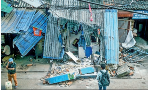
कोलकाता येथे उद्ध्वस्त करण्यात आलेले तुणमूलचे कार्यालय