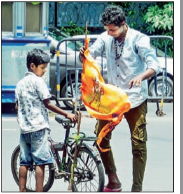
सत्ता बदलानंतर पश्चिम बंगालमधील सामाजिक वातावरणाने मुक्त नव्या घेतला. भगवा ध्वज घेऊन फिरताना कोलकाता शहरातील चिमुकला