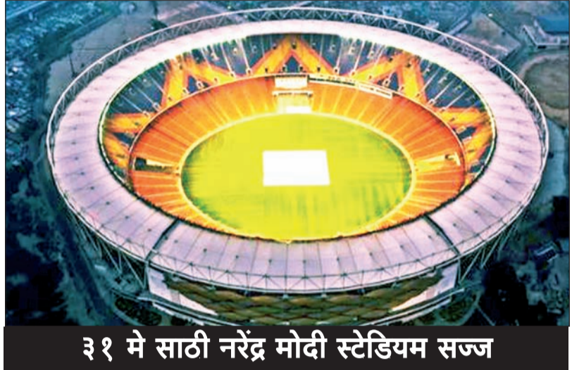
३१ मे साठी नरेंद्र मोदी स्टेडियम सज्ज

पहिला क्वालिफायर धर्मशाळा येथे तर दुसरा क्वालिफायर व एलिमिनेटर सामना न्यू चंदीगडच्या मुल्तानपूर येथे खेळविला जाईल