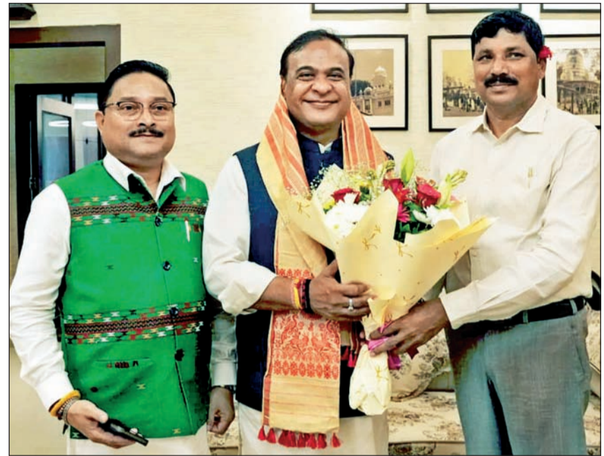
आसाममधील विजयाचे शिल्पकार मुख्यमंत्री हिमंता बिस्व सरमा

सर्व १६ जागांवर विजय मिळवला आणि १५ विरुद्ध एक अशा आपल्या मागील निवडणुकीतील कामगिरीत सुधारणा केली. २०२४ च्या सार्वत्रिक निवडणुकांचे निकाल असे दर्शवतात की, पटाशपूर विधानसभा मतदारसंघात तृणमूलने आपली आघाडी कायम राखली होती. मात्र, बंगालादेशला लागून असलेल्या सीमावर्ती जिल्ह्यांमध्ये जेथे बांगलादेशी नागरिक मोठ्या संख्येने वास्तव्यास आहेत त्या भागात तृणमूल काँग्रेसला चांगले यश मिळाले आहे. विशेषतः सुरक्षेच्या दृष्टीने महत्त्वाच्या आणि संवेदनशील असलेल्या 'बिक्न नेक' या भागात तीन-ते चार जागा तृणमूलने जिंकल्या आणि त्यातील बहुतांश आमदार मुस्लिम आहेत. (वृत्तसंस्था)