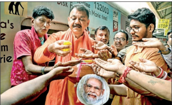
भाजपाच्या विजयानंतर हावडा येथे मिठाईचे वाटप करताना भाजपा समर्थक

◆ राज्यातील शिक्षण क्षेत्रात क्रांती घडवून आणण्याचे श्रेय असलेले प्रख्यात नेते के. कामराज यांच्या नावाने १०० विशेष निवासी शाळा स्थापन करण्याचे आणि उच्च शिक्षणासाठी २० लाख रुपयांपर्यंतचे कर्ज, यासह अनेक आश्वासने दिली आहेत. आता ही आश्वासने टीव्हीकेला पूर्ण करावी लागणार आहे. विरोधकही ही आश्वासने पूर्ण करण्यासाठी त्यांच्यावर दबाव टाकणार आहे.