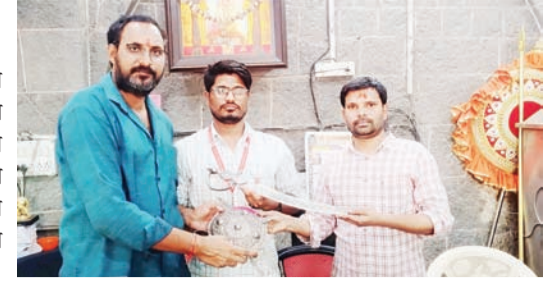
तुळजापूर येथे आल्या होत्या. यावेळी

देशातील विविध राज्यांतील निकाल आणि महाराष्ट्रातील पोटनिवडणुकीतील यशामुळे कार्यकर्त्यांमध्ये नवचैतन्य निर्माण झाले असून धाराशिव जिल्ह्यात संघटनात्मक काम अधिक वेगाने राबविले जाईल, असा विश्वास