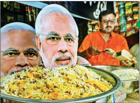
भोपाळ येथे झालेले वितरण करताना भाजपा समर्थक

◆ नवी दिल्ली, ४ मे श्यामाप्रसाद मुखर्जी यांचे स्वप्न नरेंद्र मोदी यांनी पूर्ण केले आहे. भाजपा पहिल्यांदाच बंगालमध्ये सरकार स्थापन करीत आहे. भाजपाची निवडणुकीची गंगा पाटण्याच्या समोर नेण्यासाठी पंतप्रधान नरेंद्र मोदी यांचे भगीरथ प्रयत्न सर्वांनी पाहिले आहे. भाजपा गंगोत्री धामच्या उत्तराखंडात अगोदरच सत्तेत आहे. मग भाजपाचा झेंडा उत्तरप्रदेश आणि बिहारमध्ये येऊन थांबला. आता बंगालनंतर संपूर्ण पूर्वेत भाजपा नवीन अध्याय लिहिण्यास सज्ज आहे. सोमवारी सकाळी बंगाल विधानसभेचे निकाल समोर येणे सुरू झाल्यावर भाजपाची सत्ता येणार हे चित्र दुपारपर्यंत स्पष्ट झाले. मुख्यमंत्रीपद कुणाला दिले जाईल केवळ इतकीच चर्चा कोलकाताच्या कालीघाट ते दिल्लीच्या दिनदयाल उपाध्याय मार्गापर्यंत नव्हती.