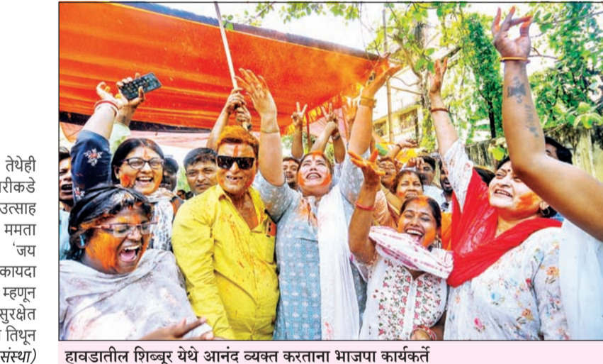
हावडातील शिबूर येथे आनंद व्यक्त करताना भाजपा कार्यकर्ते

घ्यावे लागते. मुख्यमंत्री एम. के. स्टॅलिन यांच्या नेतृत्वाखालील डीएमके सरकारने अनेक योजना राबवल्या. परंतु, शासन म्हणजे केवळ योजनांचा विस्तार करणे नव्हे. त्यासाठी विश्वासाचे सातत्यही आवश्यक असते. अलिकडच्या काळात, वाढलेले वीज दर, मातमता कर आणि शहरी गोंधळ यांसारख्या समस्यांचा सामनाय नागरिकांच्या जीवनावर थेट परिणाम झाला आहे. जेव्हा हे छोटे असतोच एकर येतात, तेव्हा ते सत्ताविरोधी लाटेचा एक प्रबळ प्रवाह बनतात.