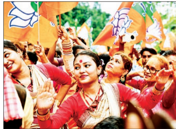
पारंपरिक नृत्य सादर करीत विजयाचा आनंद साजरा करताना गुवाहाटी येथील भाजपा कार्यकर्ते