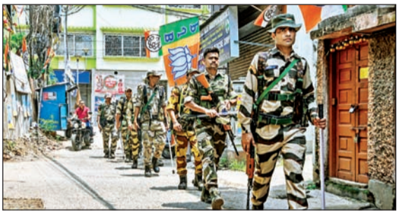
मतमोजणीच्या प्रुष्ठभूमीवर प. बंगालमधील हावडा येथे गर्स्त घालताना निमलधरी दलाचे जवान

पश्चिम बंगाल, आसाम, केरळ, तामिळनाडू आणि केंद्रशासित प्रदेश पुडुचेरी या चार राज्यांमधील विधानसभा निवडणुकांचे निकाल सोमवारी लागणार आहेत. यात सर्वाधिक चुरशीचा निकाल पश्चिम बंगालचा राहिल. आसाम, पुडुचेरीत पुन्हा भाजपा सत्तेत येईल, तामिळनाडूत स्टॅलिन यांची सत्ता कायम आणि केरळात व्हीडीएफ सत्तेत येईल, असा 'एक्झिट पोल'चा अंदाज आहे. हे अंदाज कितपत खरे ठरतात, याची उत्सुकता शिगेला पोहचली आहे.