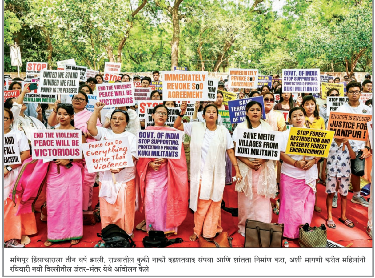
मणिपूर हिंसाचाराला तीन वर्षे झाली. राज्यातील कुकी नाकां दहशतवाद संपवा आणि शांतता निर्माण करा, अशी मागणी करीत महिलांनी रविवारी नवी दिल्लीतील जंतर-मंतर येथे आंदोलन केले