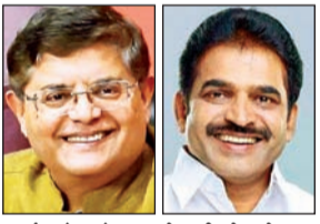
बैजयंत पांडा के. सी. वेणुगोपाल

के. सी. वेणुगोपाल यांच्याकडे लोकलेखा ◆ नवी दिल्ली, ३ मे लोकसभेचे अध्यक्ष ओम बिर्ला यांनी आज विविध सांसदीय समित्यांच्या अध्यक्षांची घोषणा केली. भाजपचे बैजयंत पांडा यांची सार्वजनिक उपक्रम समितीचे तर काँग्रेसचे के. सी. वेणुगोपाल यांची लोक लेखा समितीचे अध्यक्ष म्हणून नियुक्ती केली. ओम बिर्ला यांनी २०२६ २७ या वर्षासाठी पांडा यांची सार्वजनिक उपक्रम समितीचे तर वेणुगोपाल यांची संसदेच्या लोकलेखा समितीचे अध्यक्ष म्हणून नियुक्ती केली. सामान्यपणे लोकलेखा समितीचे अध्यक्ष हे लोकसभेतील विरोधी पक्षनेते असतात. पण विरोधी पक्षनेते राहुल गांधी यांनी या समितीचे अध्यक्षपद न स्वीकारता ते वेणुगोपाल यांच्याकडे देण्याची सूचना केली. वेणुगोपाल यांची लोकलेखा समितीचे अध्यक्ष म्हणून फेरनिवड झाली आहे. १ मे २०२६ ते ३० एप्रिल २०२७ या काळासाठी ही नियुक्ती आहे. लोकलेखा समितीत २१ सदस्य असतात, यातील १५ सदस्य लोकसभेचे तर ६ सदस्य राज्यसभेचे असतात. बैजयंत पांडा यांच्या नेतृत्वातील सार्वजनिक उपक्रम समितीत २२ सदस्य असून यातील १५ लोकसभेचे तर ७ राज्यसभेचे आहेत. भाजपचे फगनसिंह कुलस्ते यांना अनुसूचित जाती आणि जमाती समितीच्या अध्यक्षपदी नियुक्त करण्यात आले असून या समितीत ३० सदस्य असतात. यात लोकसभेच्या २० तर राज्यसभेच्या १० सदस्यांचा समावेश असतो. भाजपचे संजय जयस्वाल यांनी प्राक्कलन समितीचे अध्यक्ष म्हणून नियुक्ती करण्यात आली. या समितीतही ३० सदस्य असतात, त्यातील लोकसभेच्या २० तर राज्यसभेच्या १० सदस्यांचा समावेश असतो. (वृत्तसंस्था)