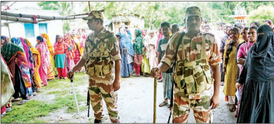
फेरमतदानाच्यावेळी गडबड होऊ नये म्हणून तैनात करण्यात आलेले अर्धसैनिक दलाचे जवान