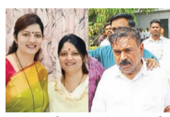
रूपयांच्या घोस्ट अकाऊंटचा भंडाफोड झाला आहे.