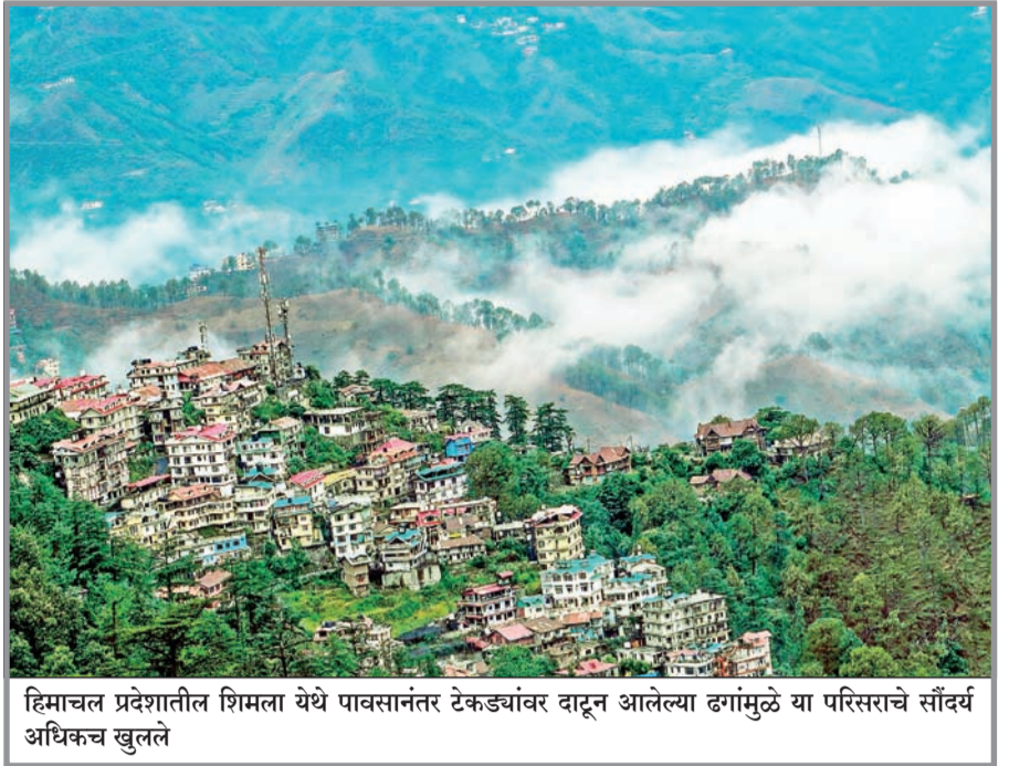
हिमाचल प्रदेशातील शिमला येथे पावसांतर टेकड्यांवर दाटून आलेल्या ढगांमुळे या परिसराचे सौंदर्य अधिकच खुलले