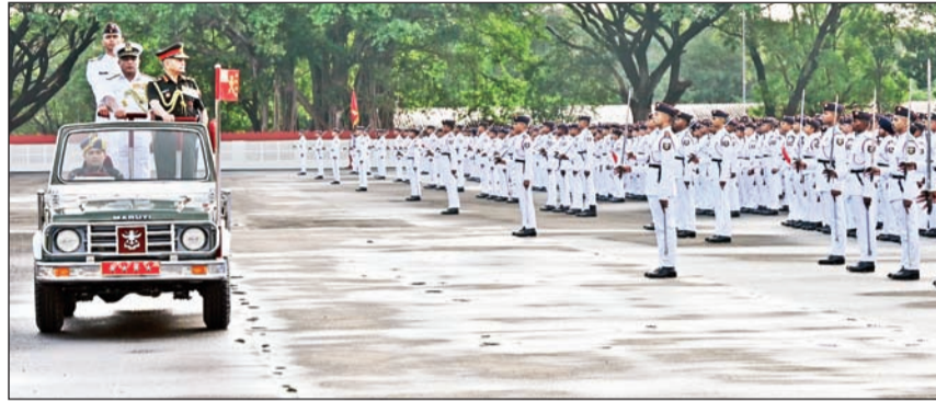
एनडीएच्या विद्यार्थ्यांकडून मानवंदना स्वीकारताना लष्करप्रमुख उपेंद्र द्विवेदी