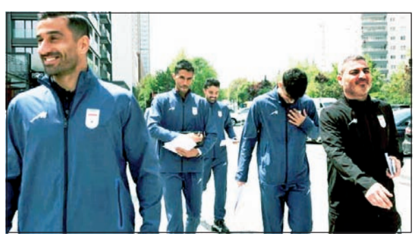
फिफा विश्वचषकापूर्वी व्हिसा प्रक्रियेसाठी अंकारा येथील कॅनडाच्या दूतावासाबाहेर इराणचे फुटबॉल खेळाडू व कर्मचारी

फिफा फुटबॉल विश्वचषकाची तयारी ● अंकारा, २१ मे २०२६ फिफा विश्वचषकाच्या पृष्ठभूमीवर इराणच्या राष्ट्रीय फुटबॉल संघाने गुरुवारी तुर्कीची राजधानी अंकारा येथे व्हिसासाठी अर्ज केले. संपूर्ण संघाने कॅनेडियन व्हिसासाठी अर्ज केला असून, काही खेळाडूंनी अमेरिकेत प्रवेशासाठीही अर्ज सादर केले आहेत. विश्वचषकाचे आयोजन अमेरिका, कॅनडा आणि मेक्सिको संयुक्तपणे करणार असून, इराण आपले गट फेरीतील तिन्ही सामने अमेरिकेत खेळणार आहे. परदेशात असलेले काही इराणी