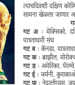
१२ जून रोजी सलामीचा सामना मेक्सिको सिटीमध्ये मेक्सिको वि. दक्षिण कोरिया यांच्यात खेळला जाणार असून त्याचदिवशी दक्षिण कोरिया व युईएफए पाथ डी संचादरम्यान सामना खेळला जाणार आहे.

● मेक्सिको, २१ मे आगामी १२ जूनपासून प्रारंभ होणाऱ्या २०२६ च्या फिफा फुटबॉल विश्वचषकात एकूण ४८ संघ सहभागी होणार आहे. आधीच्या विश्वचषकात ३२ संघांचा सहभाग होता, यंदयाच्या विश्वचषकात सहभागी होणाऱ्या संघांची संख्या वाढविण्यात आली आहे. ४८ संघांच्या या विस्तारित स्पर्धेची रचना नवीन स्वरूपाची आहे, गट फेरी : सहभागी संघांची प्रत्येकी ४ संघांच्या अशा १२ गटांमध्ये विभागणी केली जाईल. बाद फेरी : प्रत्येक गटातील अव्वल दोन संघ, तसेच तिसऱ्या क्रमांकावर राहिलेल्या आठ सर्वोत्तम संघांसह, स्पर्धेच्या नव्याने समाविष्ट करण्यात आलेल्या ३२-संघांच्या फेरीत प्रवेश करतील. या स्पर्धेत एकूण १०४ सामने खेळले जातील.