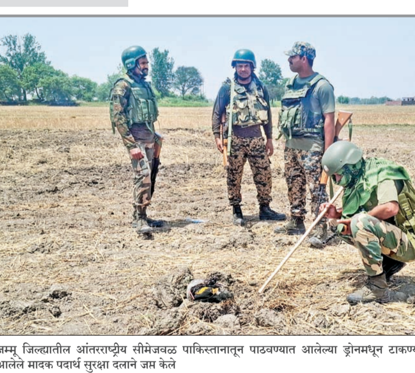
जम्मू जिल्ह्यातील आंतरराष्ट्रीय सीमेजवळ पाकिस्तानातून पाठवण्यात आलेल्या ड्रोनमधून टाकण्यात आलेले मावक पदार्थ सुरक्षा दलाने जप्त केले