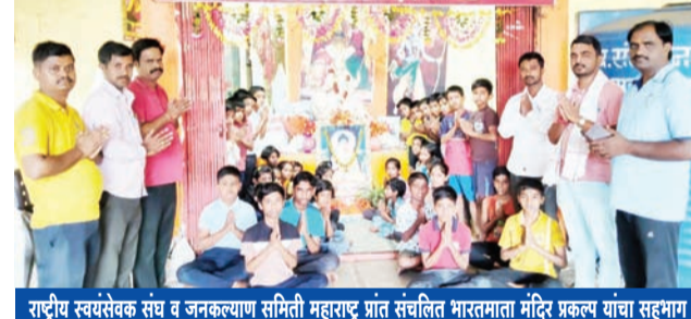
राष्ट्रीय स्वयंसेवक संघ व जनकल्याण समिती महाराष्ट्र प्रांत संचलित भारतामाता मंदिर प्रकल्प यांचा सहभाग

राष्ट्रीय स्वयंसेवक संघ व जनकल्याण समिती महाराष्ट्र प्रांत संचलित भारतामाता मंदिर प्रकल्प, लोहारा येथे दरवर्षीप्रमाणे यंदाही दि. २७ एप्रिल ते ०४ मे या कालावधीत बाल संस्कार शिबिर उत्साहपूर्ण वातावरणात पार पडले. या शिबिरात एकूण ६० विद्यार्थ्यांनी सहभाग घेतला असून ७ शिक्षकांनी विविध उपक्रमांद्वारे त्यांना मार्गदर्शन केले. या शिबिरामध्ये व्यायाम,