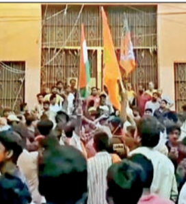
आणि लक्ष्मी पूजेच्या काळातच मंदिर उघडले जात असे. अलीकडील विधानसभा निवडणुकीनंतर

◆ आसनसोल, ५ मे आसनसोल येथील बस्तीन बाजार परिसरातील श्री-श्री दुर्गामाता चॅरिटेबल ट्रस्टच्या दुर्गा मंदिराचे दरवाजे अनेक वर्षांनंतर पुन्हा भाविकांसाठी खुले करण्यात आले आहेत. दीर्घकाळ बंद असलेले हे मंदिर उघडताच मोठ्या संख्येने नागरिकांनी तेथे हजेरी लावली. स्थानिकांच्या मते, हे मंदिर त्यांच्या श्रद्धेचे केंद्र असून ते वर्षभर बंद राहिल्यामुळे भाविकांना मोठी अडचण होत होती. काही वर्षांपासून धार्मिक तणावाचे कारण देत मंदिरात नियमित पूजा होत नव्हती. फक्त दुर्गा पूजा