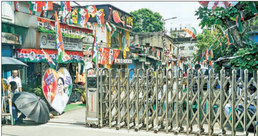
तृणमूल काँग्रेसचा प्रभाव असलेल्या भागांमध्ये निकालानंतर असा शुकशुकाट होता

पंतप्रधान मोदींचा प्रचारसभेत वर्तविलेला अंदाज खरा ठरला