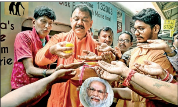
भाजपाच्या विजयानंतर हावडा येथे मिठाईचे वाटप करताना भाजपा समर्थक

◆ राज्यातील शिक्षण क्षेत्रात क्रांती घडवून आणण्याचे श्रेय असलेले प्रख्यात नेते के. कामराज यांच्या नावाने १०० विशेष निवासी शाळा स्थापन करण्याचे आणि उच्च शिक्षणासाठी २० लाख रुपयांपर्यंतचे कर्ज, यासह अनेक आश्वासने दिली आहेत. आता ही आश्वासने टीव्हीकेला पूर्ण करावी लागणार आहे. विरोधकही ही आश्वासने पूर्ण करण्यासाठी त्यांच्यावर दबाव टाकणार आहे.