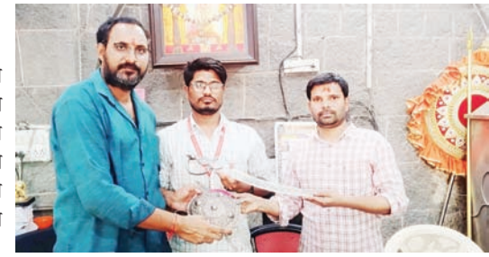
तुळजापूर येथे आल्या होत्या. यावेळी

देशातील विविध राज्यांतील निकाल आणि महाराष्ट्रातील पोटनिवडणुकीतील यशामुळे कार्यकर्त्यांमध्ये नवचैतन्य निर्माण झाले असून धाराशिव जिल्ह्यात संघटनात्मक काम अधिक वेगाने राबविले जाईल, असा विश्वास