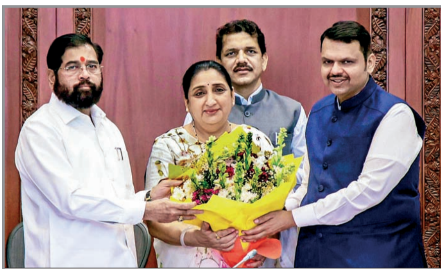
बारामती पोटनिवडणुकीत विजयी मताधिक्याने विजय मिळविल्यानंतर उपमुख्यमंत्री सुनेत्रा पवार यांचे अभिनंदन करताना मुख्यमंत्री देवेंद्र फडणवीस आणि उपमुख्यमंत्री एकनाथ शिंदे

किडसवाणी निवडणूक कधीच पाहिली नव्हती. ही निवडणूक भाजपविरुद्धची लढत नव्हती, तर ती संपूर्ण सरकारी यंत्रणेविरुद्धची लढाई होती. विशेषतः पंतप्रधान आणि गृहमंत्री यांच्या थेट हस्तक्षेपाविरुद्धची निवडणूक होती. ममता बॅनर्जी यांनी दावा केला की, एका कटकारस्थानाचा भाग म्हणून मतदार यादीतून ९० लाख नावे वगळण्यात आली होती. तृणमूल काँग्रेसने न्यायालयाचा दरवाजा ठोठावल्यानंतरच ३२ लाख नावे पुन्हा समाविष्ट करण्यात आली. मात्र, हा फेरफार तिथेच थांबला नाही. त्यानंतर पुन्हा ७ लाख नावे गुप्तपणे यादीत जोडण्यात आली. ही कृती सर्वाना अंधारात ठेवून पार पडली. २००४ मध्ये जेव्हा त्या पूर्णपणे एकाकी पडल्या होत्या, तेव्हाही त्यांनी अशा प्रकारची निवडणूक लुटमार आणि अत्याचार कधीच पाहिले नव्हते. (वृत्तसंस्था)