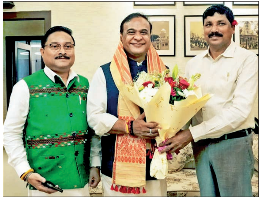
आसाममधील विजयाचे शिल्पकार मुख्यमंत्री हिमंता बिस्व सरमा

२९४ सदस्यांच्या विधानसभेत तृणमूलची ताकद अवघ्या ८० जागांपर्यंत खाली येऊन तिचे पूर्णपणे पानिपत झाले. भाजपाने आपल्या पूर्वेकडील शेवटच्या बालेकिल्ल्यातही निर्णायक मुसंडी मारल्याचे या निकालावरून अधोरेखित झाले आहे. यासह अंग, बंग आणि कलिंग (बिहार, बंगाल आणि ओडिशा) या प्रदेशांत भाजपाची भगवी कमान पूर्ण झाली आहे. भाजपाच्या कामगिरीच्या आलेखात सर्वात अव्वल स्थानी पूर्व मेदिनीपूर जिह्हा आहे. येथे पक्षाचे निवडणुकीतील सर्वात प्रमुख चेहरा असलेल्या शुभेंद्र अधिकारी यांनी पक्षाचे वर्चस्व पूर्णपणे प्रस्थापित केले. यासाठी खात्री केली. भाजपाने जिल्ह्यातील सर्व्हा