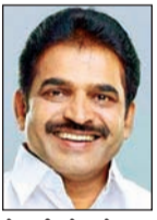
के. सी. वेणुगोपाल

वेणुगोपाल यांच्याकडे देण्याची सूचना केली. वेणुगोपाल यांची लोकलेखा समितीचे अध्यक्ष म्हणून फेरनिवड झाली आहे. १ मे २०२६ ते ३० एप्रिल २०२७ या काळासाठी ही नियुक्ती आहे. लोकलेखा समितीत २१ सदस्य असतात, यातील १५ सदस्य लोकसभेचे तर ६ सदस्य राज्यसभेचे असतात. बैजयंत पांडा यांच्या नेतृत्वातील सार्वजनिक उपक्रम समितीत २२ सदस्य असून यातील १५ लोकसभेचे तर ७ राज्यसभेचे आहेत. भाजपाचे फगनसिंह कुलस्ते यांना अनुसूचित जाती आणि जमाती समितीच्या अध्यक्षाची नियुक्त करण्यात आले असून या समितीत ३० सदस्य असतात. यात लोकसभेच्या २० तर राज्यसभेच्या १० सदस्यांचा समावेश असतो. भाजपाचे संजय जयस्वाल यांनी प्राक्कलन समितीचे अध्यक्ष म्हणून नियुक्ती करण्यात आली. या समितीतही ३० सदस्य असतात, त्यातील लोकसभेच्या २० तर राज्यसभेच्या १० सदस्यांचा समावेश असतो. (वृत्तसंस्था)