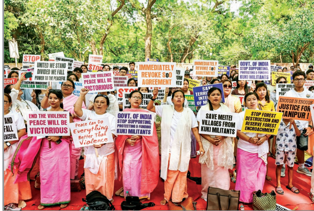
मणिपूर हिंसाचाराला तीन वर्षे झाली. राज्यातील कुकी नाकां दहशतवाद संपवा आणि शांतता निर्माण करा, अशी मागणी करीत महिलांनी रविवारी नवी दिल्लीतील जंतर-मंतर येथे आंदोलन केले