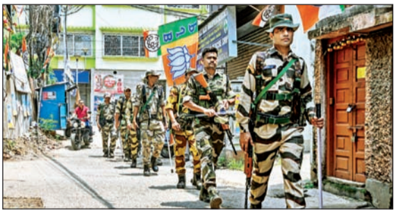
मतमोजणीच्या पृष्ठभूमीवर प. बंगालमधील हावडा येथे गर्स्त घालताना निमलधरी दलाचे जवान

पश्चिम बंगाल, आसाम, केरळ, तामिळनाडू आणि केंद्रशासित प्रदेश पुडुचेरी या चार राज्यांमधील विधानसभा निवडणुकांचे निकाल सोमवारी लागणार आहेत. यात सर्वाधिक चुरशीचा निकाल पश्चिम बंगालचा राहिल. आसाम, पुडुचेरीत पुन्हा भाजपा सत्तेत येईल, तामिळनाडूत स्टॅलिन यांची सत्ता कायम आणि केरळात व्हीडीएफ सत्तेत येईल, असा 'एग्झिट पोल'चा अंदाज आहे. हे अंदाज कितपत खरे ठरतात, याची उत्सुकता शिगेला पोहचली आहे.