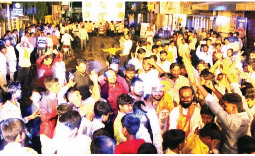
सोलापूर : मंगळवारी सायंकाळी महात्मा बसवेश्वर जन्मोत्सवनिमित्त मंडळांनी उत्साही वातावरणात भव्य मिरवणूक काढली. त्याप्रसंगी जल्लोष करताना टिपलेले छायाचित्र.