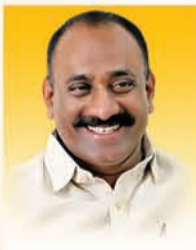
मा. सचिन कल्याणशेटी आमदार, अक्कलकोट विधानसभा