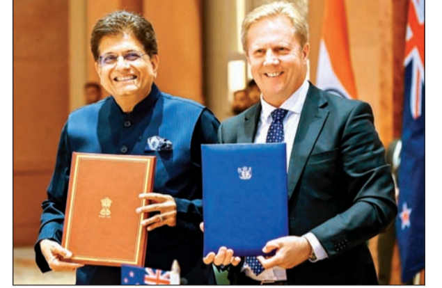
पीयूष गोयल आणि न्यूझीलंडचे मंत्री टॉड मॅक्ले यांनी व्यापार करारावर स्वाक्षरी केली

या कराराचा उद्देश द्विपक्षीय व्यापार दुप्पट करणे, भारतीय निर्यातदारांना न्यूझीलंडच्या बाजारपेठेत शुल्कमुक्त प्रवेश देणे आणि पुढील १५ वर्षात २० अब्ज डॉलर्सची गुंतवणूक आकर्षित करणे हा आहे. दोन्ही देशांमधील व्यापार आणि गुंतवणुकीवर परिणाम करू शकणारे इतर अडथळे कमी करणे हा देखील या कराराचा उद्देश असल्याचे गोयल यांनी सांगितले. या करारामुळे न्यूझीलंडमध्ये निर्यात करण्यात येणाऱ्या भारतीय उत्पादनाला कुठेही शुल्क लागणार नाही. यामुळे