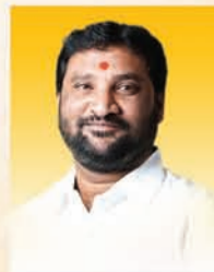
मा. दत्ताभाऊ कुलकर्णी जिल्हाध्यक्ष, भा.ज.पा. धाराशिव