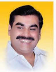
मा. जयवंतराव जंगताप मा. आमदार, कामठा विधानसभा