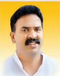
मा. राजजितसिंह निंबाळकर मा. खासदार, मादा लोकसभा