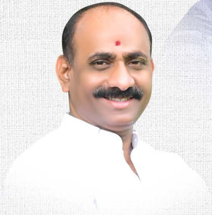
मा. सचिन कल्याणशेट्टी आमदार अक्कलकोट विधानसभा