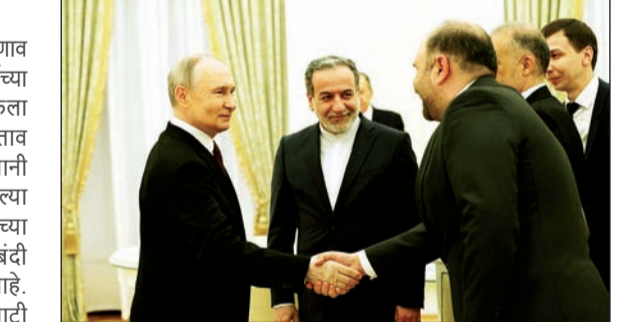
अराघची यांच्या नेतृत्वातील शिष्टमंडळाने पुतिन यांची भेट घेतली

◆ तेहरान, २७ एप्रिल मध्यपूर्वेतील सध्याचा तणाव आणि खडबडलेल्या शांतता चर्चेच्या पृष्ठभूमीवर इराणने अमेरिकेला एक नवीन शांतता प्रस्ताव पाठविला आहे. पाकिस्तानी मध्यस्थामार्फत सादर केलेल्या प्रस्तावात, होर्मुझच्या सामुद्रधुनीतील नाकाबंदी हटविण्याची अट ठेवली आहे. अण्वस्त्र मुद्यावर वाटाघाटी करण्याची तयारी त्यांनी नवीन प्रस्तावातून दर्शविली आहे.