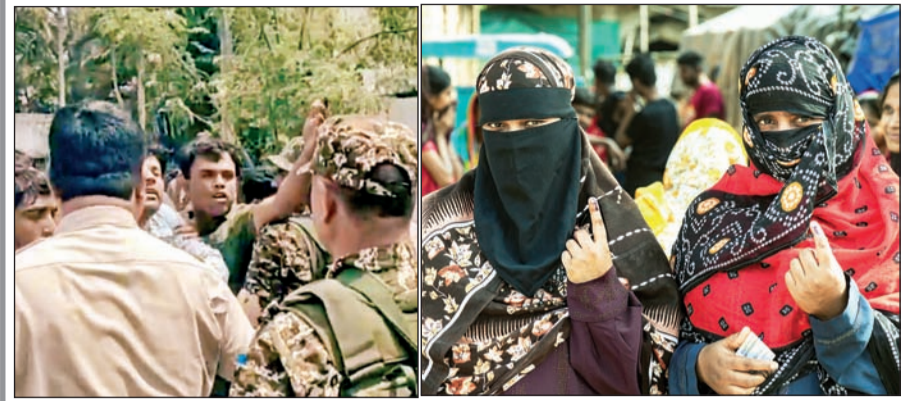
गोंधळी कार्यकर्त्यांना ताब्यात घेताना जवान

कुचबिहारच्या तुफानगंज येथील मतदान केंद्रावर मोठ्या प्रमाणात गर्दी झाल्याने तणाव निर्माण झाला. परिस्थिती नियंत्रणात आणण्यासाठी केंद्रीय सशस्त्र पोलिस दलाला सौम्य लाठीमार करावा लागला. काही असामाजिक तत्व मतदारांच्या घाबरवण्याचा प्रयत्न करीत होते. त्यामुळे बळचा वापर करावा लागल्याने अधिकाऱ्यांनी सांगितले.