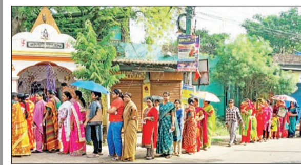
पश्चिम बंगालमधील मिदनापूर येथील केंद्रावर मतदानासाठी लागलेली महिलांची रांग