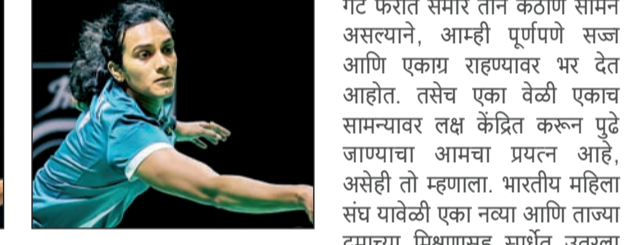
पी. व्ही. सिंधू

सुरुवातीच्या टप्प्यातच एका आह्वानात्मक वेळापत्रकाचा सामना करावा लागणार आहे. पुरुष संघ आपला पुढील सामना २७ एप्रिल रोजी (दुपारी १२ वाजता) ऑस्ट्रेलियाविरुद्ध खेळेल व त्यानंतर २९ एप्रिल रोजी (दुपारी १.३० वाजता) चीनविरुद्ध एका अत्यंत महत्त्वाच्या आणि अटीतटीच्या लढतीसाठी सज्ज होईल. दुसरीकडे, महिला संघ आपली मोहीम