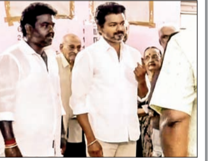
तामिळनाडूतील एका केंद्रावर मतदानासाठी लागलेली रांग