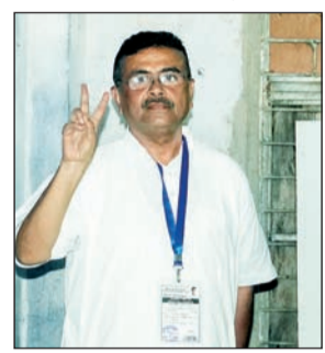
मतदानानंतर विजयी खूण दाखविताना भाजपाचे शुभेंद्र अधिकारी