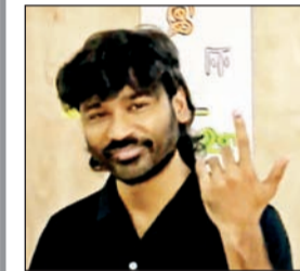
मुख्यमंत्री एम. के. स्टॅलिन