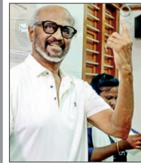
चेन्नई येथील विविध मतदान केंद्रावर अभिनेते रजनीकांत, कमल हसन, श्रुति हसन, थलपती विजय यांनी मतदानाचा हक्क बजावला