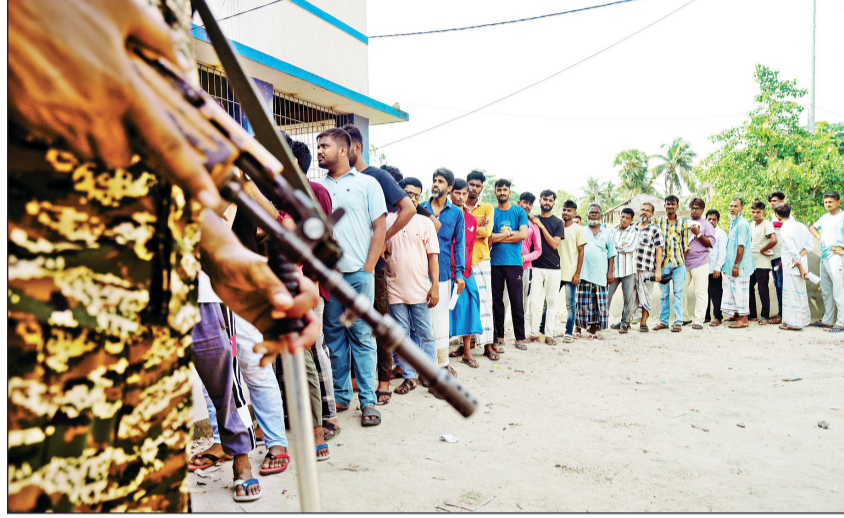
नंदीग्राम येथील मतदान केंद्रावर मतदारांची झालेली ही गर्दी. येथे चोख सुरक्षा ठेवण्यात आली होती

◆ नवी दिल्ली, २३ एप्रिल पश्चिम बंगाल आणि तामिळनाडूमध्ये गुरुवारी स्वातंत्र्यापासूनची आतापर्यंतची सर्वाधिक मतदानाची नोंद झाली. यामध्ये मतदानाचे प्रमाण अनुक्रमे ११.११ आणि ८४.४० टक्क्यांपर्यंत पोहोचले, अशी माहिती मुख्य निवडणूक आयुक्त ज्ञानेशकुमार यांनी दिली. पश्चिम बंगालच्या काही भागांत हिंसाचाराच्या घटना घडल्या. तामिळनाडूत सर्वांचे लक्ष वेधून घेणाऱ्या बहुपक्षीय लढतीचा सामना करावा लागला असूनही, या दोन्ही राज्यांतील निवडणूक प्रक्रियेत मतदारांचा प्रचंड सहभाग दिसून आला.