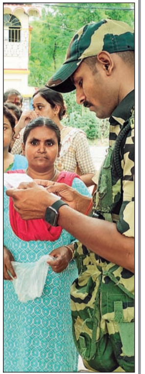
मुर्शिदाबाद : ओळखपत्राची पाहणी करताना सुरक्षा जवान