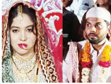
फैजानला अटक करण्यात आली आहे.

तथा वृत्तसेवा सोलापूर, दि. १६ एप्रिल - सासरी जाऊन एका पतीने पेट्रोल ओतून पत्नीचा जाळून खून करण्याचा प्रयत्न केल्याप्रकरणी पतीवर खुनाचा प्रयत्न केल्याचा तर पत्नीच्या कुटुंबीयांतील आठ जणांवर विजापूर नाका पोलिस ठाण्यात कौटुंबिक हिंसाचाराचा गुन्हा दाखल करण्यात आला आहे. दरम्यान आरोपी पती