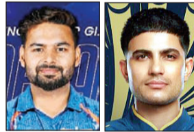
ऋषभ पंत शुभमन गिल