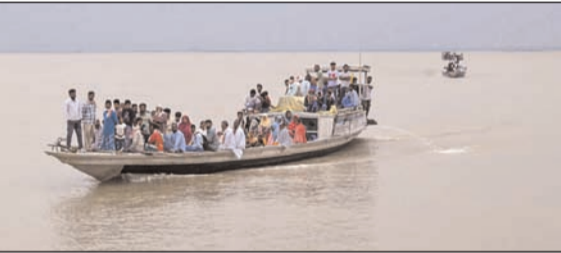
दारंग जिल्ह्यात ब्रह्मपुत्रा नदी ओलांडून मतदानासाठी जाताना नागरिक

◆ नवी दिल्ली, ९ एप्रिल आसाम, केरळ आणि पुडुचेरी या केंद्रशासित प्रदेशातील विधानसभा निवडणुकीसाठीचे मतदान गुरुवारी सायंकाळी ६ वाजेपर्यंत पार पडले. निवडणूक आयोगाच्या माहितीनुसार, आसाममध्ये रात्री आठ वाजेपर्यंत ८५.३५ टक्के मतदान झाले. आसामच्या इतिहासातील हे सर्वाधिक मतदान आहे. केरळमध्ये ४९ वर्षातील दुसऱ्या क्रमांकाचे सर्वाधिक मतदान ७७.९७ टक्के नोंदवले गेले. पुडुचेरीमध्ये ८९.७८ टक्के मतदान झाले. आसाममध्ये निवडणुकीची संबंधित हिंसाचारात सुमारे ३०