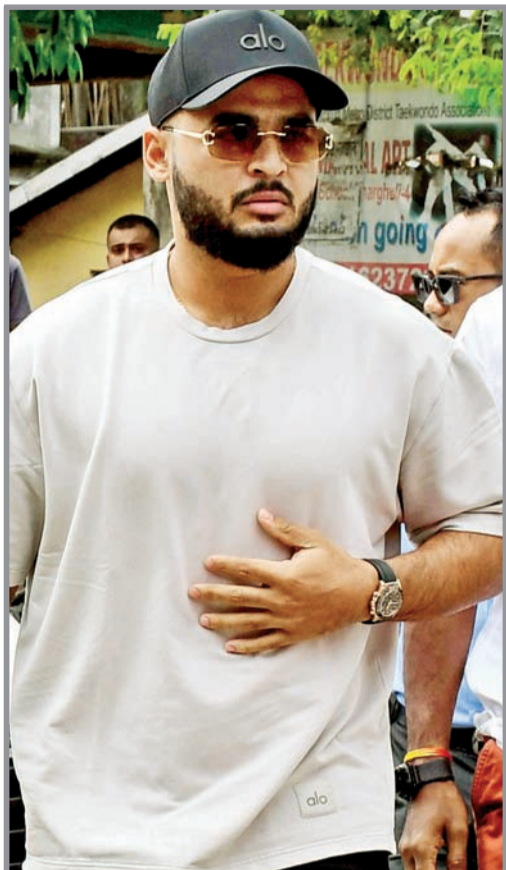
आसाम विधानसभा निवडणुकीदरम्यान, क्रिकेटपटू रियान परगाम मतदान करण्यासाठी गुवाहाटी येथील एका मतदान केंद्रावर दाखल झाला

शिमला : येथे गुरुवारी पार पडलेल्या आशियाई युवा टेबल टेनिस अजिंक्यपद स्पर्धेच्या प्रादेशिक पात्रता फेरीत भारताच्या १९ वर्षाखालील मुलींच्या संघाने सलग केलेल्या वर्चस्वपूर्ण कामगिरीसह आपली अजिंक्य मालिका कायम राखली. सांघिक स्पर्धा पूर्ण झाल्यानंतर गुरुवारी हाती आलेल्या निकालानुसार, भारताने चारपैकी तीन सांघिक विजेतेपदे - १९ वर्षाखालील मुली, १५ वर्षाखालील मुले आणि १५ वर्षाखालील मुली - पटकावलीत. या कामगिरीने कनिष्ठ स्तरावर देशाची ताकद व खेळाडूंची सखोल गुणवत्ता अधोरेखित झाली आहे. यजमान भारताला हुकलेले एकमेव विजेतेपद १९ वर्षाखालील मुलांच्या गटातील होते, या गटात अत्यंत चुरशीच्या लढतीत बांगलादेशने अव्वल स्थान पटकावले. या गटात भारताने आपला संघ मैदानात उतरवला नव्हता, कारण गत वर्षी ताश्कंद येथे झालेल्या आशियाई अजिंक्यपद स्पर्धेदरम्यानच भारताने या गटासाठीची पात्रता आधीच निश्चित केली होती. गुरुवारी यजमान भारताने नेपाळ, मालदीव आणि बांगलादेश यांच्यावर ३-० अशा एकतर्फी आणि निर्णायक विजयाची नोंद केली. यासह राऊंड-१०बिन गुणतालिकेत भारताने सहजपणे अव्वल स्थान पटकावले. तपूर्वी, बुधवारीही यजमान संघाने श्रीलंकेचा अशाच मोठ्या फरकाने पराभव केला होता. चारही लढतींमध्ये विजय मिळवित भारताने या गटातील सुवर्णपदक केवळ कायमच राखले नाही, तर आगामी खेडीय अजिंक्यपद स्पर्धेसाठी अव्वल मानांकित संघ म्हणून पात्रताही मिळविली. दुसऱ्या स्थानावर राहिलेल्या श्रीलंकेने या प्रदेशातून पात्रतेचे दुसरे स्थान निश्चित केले. त्रिनिदाद गटांमधील एकेरी आणि दुहेरीच्या स्पर्धांना शुक्रवारापासून सुरुवात होणार आहे.